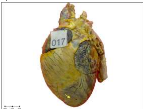
Figura 1. Ponte de miocárdio (seta) sobre um segmento do ramo interventricular paraconal da artéria coronária esquerda.

ápice cardíaco. Tal mensuração permitiu a subdivisão de cada ramo interventricular paraconal ou subsinuoso em três terços equivalentes sendo denominados de proximal, médio e distal. As pontes obedeceram a seguinte distribuição: 10,00% no terço proximal, 23,34% no terço médio e 20,00% no terço distal. Em 13,33% dos corações as pontes de miocárdio foram observadas nos ramos principais, direito e esquerdo, da artéria coronária. Foram observadas mais de 1 ponte no mesmo ramo interventricular paraconal em 10% de todas as pontes avaliadas. A ausência de pontes em ambos os ramos interventriculares foi verificada em 23,33% das peças dissecadas (Figura 2).