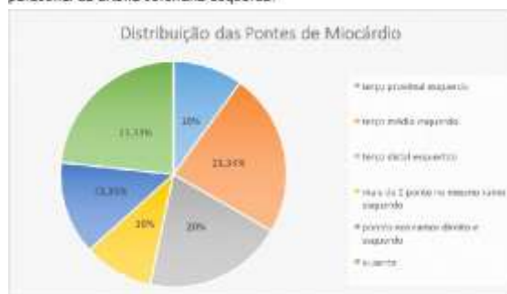
Figura 2. Distribuição das pontes de miocárdio sobre os ramos da artéria coronária.

A largura das pontes de miocárdio, no ramo interventricular paraconal, oscilou de 2,72mm a 12,29mm, com média de 6,09mm e desvio padrão de 2,23mm. A mediana