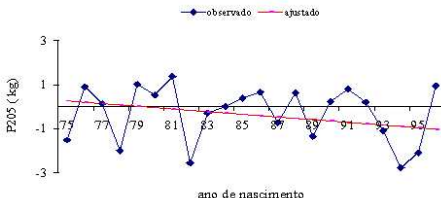
FIGURA 2 – TENDÊNCIA DOS EFEITOS GENÉTICOS MATERNOS PARA PESO A DESMAMA, PADRONIZADO PARA 205 DIAS (P205), NO PERÍODO DE 1975 A 1995, EM BOVINOS DA RAÇA NELORE. MATO GROSSO DO SUL. (n=2891).

Considerando-se o período médio de sete anos como o intervalo de gerações em bovinos da raça Nelore Mocha (FARIA et al. , 2001), a intensidade de seleção ( i ) de 1,274 (retenção de 10% de machos e 50% de fêmeas), a herdabilidade direta ( h^2 ) da TABELA 1, o desvio-padrão fenotípico ( \sigma_p ) igual a 23,03 kg, seria possível obter avanços genéticos ( \Delta G ) por geração ( \Delta G/\text{geração} = i \times \hat{h}_a^2 \times \sigma_p ) da ordem de 2,26 kg/ano, para P205, correspondendo a 1,35% da médias dos pesos. Utilizando-se a herdabilidade total \hat{h}_T^2 = (\hat{\sigma}_a^2 + 0,5 \hat{\sigma}_{am}^2 + 1,5 \hat{\sigma}_{pe}^2) / \hat{\sigma}_p^2 , e tomando-se os resultados da TABELA 1, os ganhos possíveis seriam menores em virtude do antagonismo entre os efeitos aditivos direto e materno e exatamente igual a média observada de 0,78 kg/ano, correspondendo, conforme citado, a