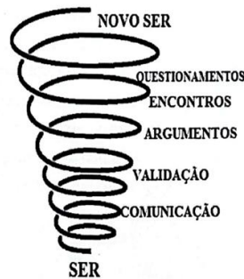
Figura 1 – Ciclos reiterativos dialéticos de uma pesquisa