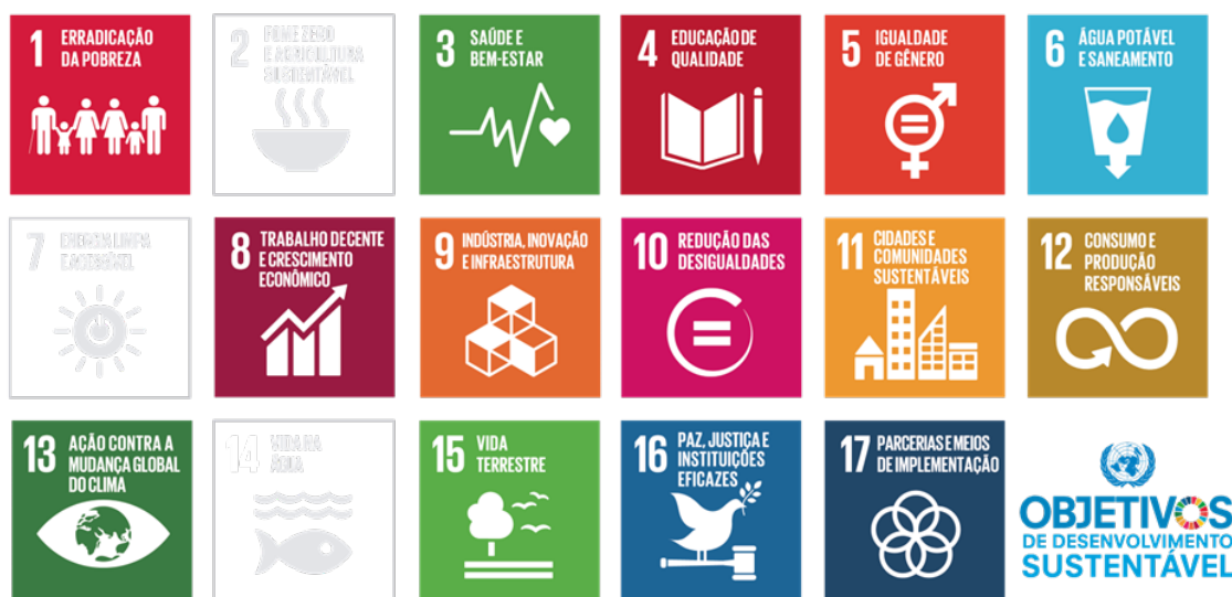
FIGURA 5: OS DEZESETE ODS PROPOSTOS PELA ONU.

A agenda, a ser cumprida até o ano de 2030, está pautada em cinco áreas de importância, sendo elas as pessoas, a prosperidade, a paz, as parcerias e o planeta (ANDRADE, 2022). Os objetivos de desenvolvimento sustentável são um apelo global à ação para acabar com a pobreza, proteger o meio ambiente e o clima e garantir que as pessoas, em todos os lugares, possam desfrutar de paz e de prosperidade (RADUNS e CALLAI, 2022). Os dezessete ODS são, conforme ilustra a figura abaixo (Figura 5): Erradicação da Pobreza; Fome zero e agricultura sustentável; Saúde e bem-estar; Educação de qualidade; Igualdade de Gênero; Água potável e saneamento; Energia limpa e acessível; Trabalho decente e crescimento econômico; Indústria, inovação e infraestrutura; Redução das desigualdades; Cidades e comunidades sustentáveis; Consumo e produção responsáveis; Ação contra a mudança global do clima; Vida na água; Vida terrestre; Paz, justiça e instituições eficazes; e Parcerias e meios de implementação.