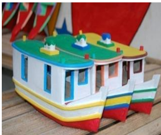
FIGURA 1 - STAND DE VENDA DO BRINQUEDO DE MIRITI.

Alça Viária; ou fluvial – baía do Guajará), assim como uma diversidade de atrações - como a produção de artesanatos de miriti (Figura 1), praias e igarapés (Figura 2), fazem de Abaetetuba um município com potencial para a atração de turistas. Contudo, ainda há pouca participação dessas atrações na cadeia produtiva local do turismo, o que faz das pesquisas sobre o setor um importante instrumento para identificar as falhas e propor soluções para o seu melhor desenvolvimento.