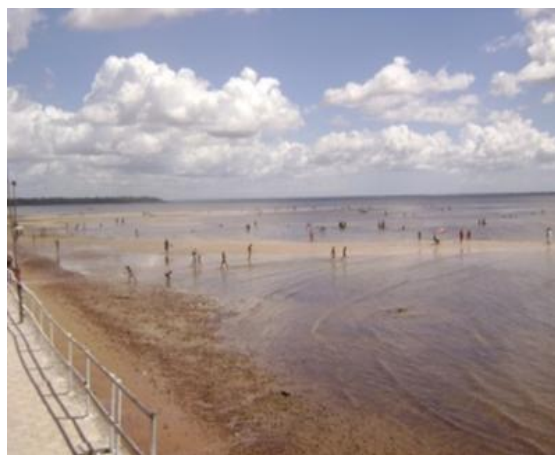
FIGURA 2 - VISTA DA PRAIA DE BEJA E DA ORLA