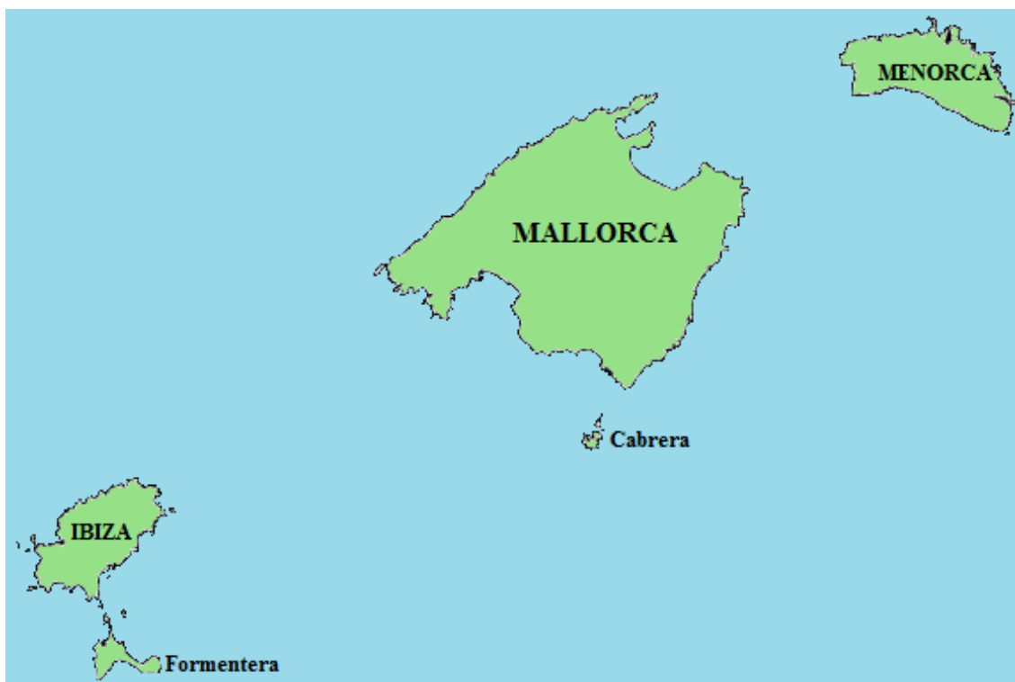
FIGURA 1 - MAPA DE LAS ISLAS BALEARES.

posee una superficie de 4.984,6 km 2 repartido entre Mallorca (3.622,5 km 2 ), Menorca (694,7 km 2 ), Ibiza (571,8 km 2 ), Formentera (82,5 km 2 ), Cabrera (13,0 km 2 ) y diversos islotes, según datos del Institut Balear d'Estadística (IBESTAT, 2012). La población residente a 1 de enero de 2012 era de 1.119.439 habitantes repartido entre Mallorca (876.147 habitantes), Menorca (95.178 habitantes), Ibiza (137.357 habitantes) y Formentera (10.757 habitantes) (IBESTAT, 2012).