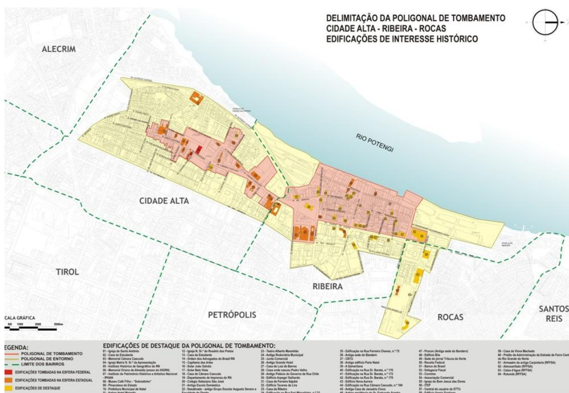
FIGURA 2 - CORREDOR CULTURAL DE NATAL.

O Corredor Cultural delimita-se como mostra a Figura 2, apresentada a seguir: