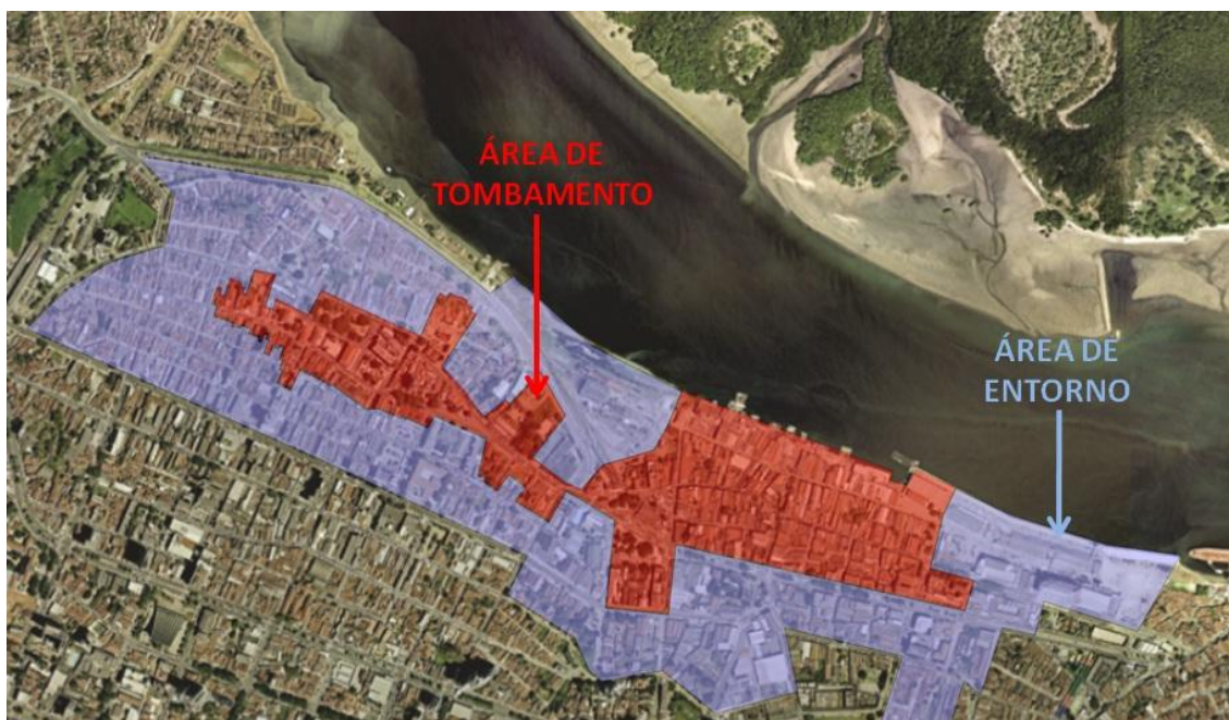
FIGURA 1 - ÁREA TOMBADA DO CORREDOR CULTURAL.

Sob essa perspectiva e trazendo esses dados para a realidade local, o Corredor Cultural de Natal tem sua área tombada pelo próprio município, o que é um fator relevante para sua efetiva restauração e implantação, como mostra a figura abaixo: