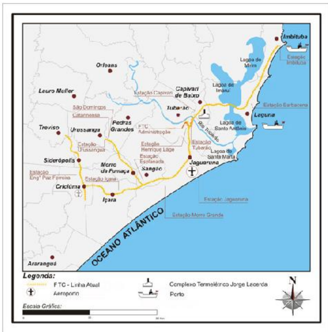
FIGURA 3: MALHA FERROVIÁRIA QUE LIGA O INTERIOR AO COMPLEXO TERMELÉTRICO E REGIÃO PORTUÁRIA. FONTE: MEDEIROS, 2006.

Neste cenário, o patrimônio industrial do sul de Santa Catarina desponta como possibilidade de grande relevância para diversificar o turismo do Estado e novos projetos que promovam a preservação da herança tecnológica local e bem-estar da população, agregando peculiaridades a região sem histórico no território brasileiro, combinando os distintos aspectos industriais desenvolvidos na história catarinense, capazes de gerarem uma nova organização espacial e social destes diversos lugares. Em suma, procurar promover um segmento benéfico e harmonioso com a população e com o meio ambiente, atraindo visitantes e investidores sensíveis à essa comarca, estimulando uma cadeia produtiva e consumidora capaz de transformar distintas