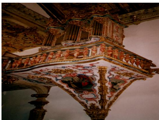
FOTO 2 - ÓRGÃO DA IGREJA MATRIZ DE SANTO ANTÔNIO / SÉC. XVIII. (TIRADENTES – MG) AUTORIA: IVAN RÊGO ARAGÃO, 2000

O turismo promove trocas entre os indivíduos de diferentes origens. E ao propiciar o encontro de pessoas, o turismo se apresenta não só como fenômeno econômico, mas também sociocultural. A atividade é capaz de envolver o fluxo de pessoas em diversas regiões e nichos culturais, e, é através desse contato, que se estabelece também uma aceitação de outros costumes. O turismo promove o intercâmbio entre diferentes culturas (com o contato entre o turista e os residentes locais) (DIAS, 2005), resultando disso mais compreensão e respeito mútuos, tolerância em relação a valores, hábitos e costumes diferentes, aceitação da pluralidade cultural como um aspecto importante da humanidade.