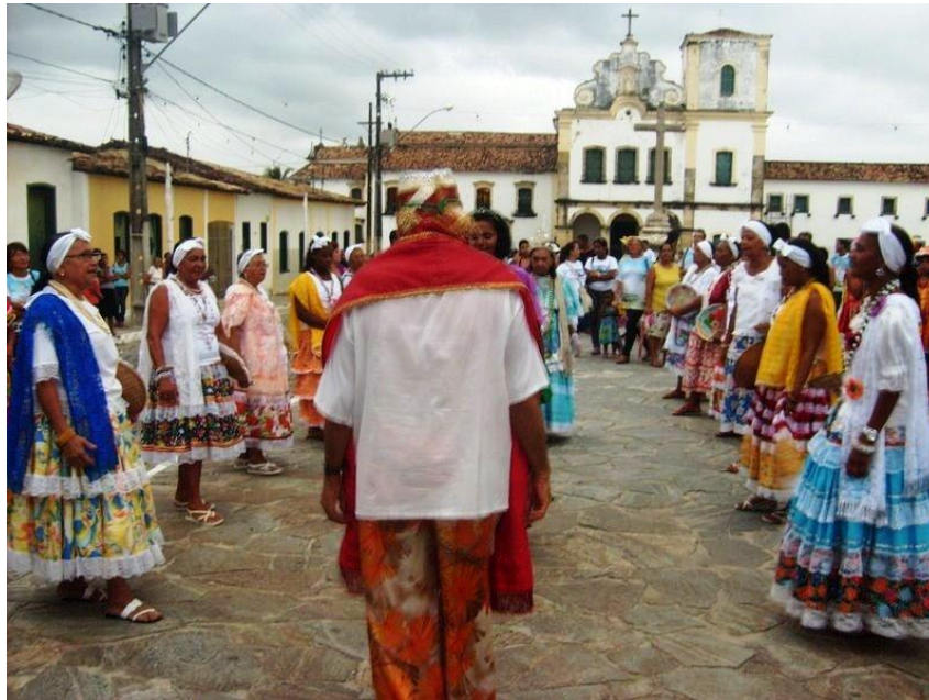
FOTO 4 - GRUPO DE TAIEIRAS SÃO CRISTÓVÃO, SERGIPE (BRASIL) AUTORIA: SÓCRATES PRADO, 2009

idades quer seja ele tangível ou não, contem essa função: de manter viva a memória do grupo através dos espaços e construções seculares, das festas e comemorações. O enraizamento da memória se dá em uma escala territorial — em alguma paisagem, em algum lugar. “É no espaço material e da memória que a identidade permanece enraizada” (PAES, 2008, p. 162).