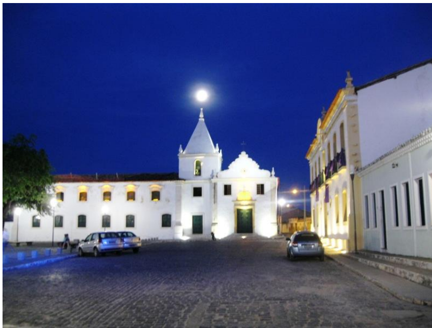
FOTO 5 - ANTIGA IGREJA E SANTA CASA DA MISERICÓRDIA, SÉC. XVIII SÃO CRISTÓVÃO – SERGIPE (BRASIL) AUTORIA: IVAN RÊGO ARAGÃO, 2011

espaços visitados. Na chamada “cultura do encontro” (ALFONSO, 2003), entre indivíduos de diferentes origens, hábitos e costumes, são desenvolvidas muitas nuances de interação, tais como a valorização do patrimônio material, com as edificações e os bens culturais móveis, e dos aspectos intangíveis da cultura, incluindo as danças, o folclore, a gastronomia e a religiosidade. O sentido de patrimônio na modernidade, [...] “surge como um artifício criado no sentido do fortalecimento de uma pertença ao espaço simbólico, atribuindo uma transcendência a determinados símbolos culturais que atestam o caráter singular de uma determinada comunidade” (BOMFIM, 2009, p. 127).