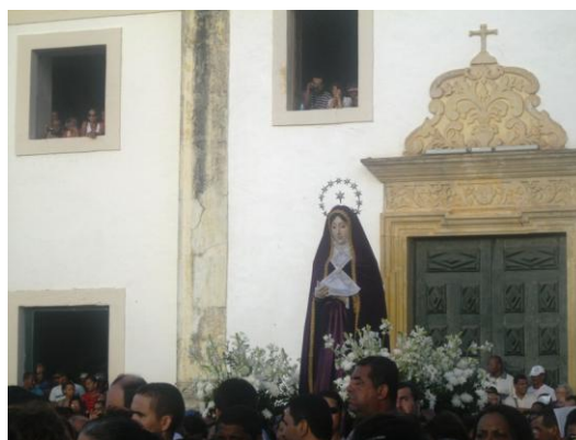
FOTO 3 - FESTA/PROCISSÃO DE NOSSO SENHOR DOS PASSOS. (SÃO CRISTÓVÃO – SERGIPE) AUTORIA: IVAN RÊGO ARAGÃO, 2011

Atualmente, o interesse pela identidade, diz respeito à percepção dos atores de que seu lugar no mundo passa por investimentos simbólicos, pelos quais eles se afirmam e negociam com outros sua forma de inserção na sociedade (BURITY, 2002). Além disso, num mundo globalizado, o diferencial entre os grupos, instituições e indivíduos passa cada vez mais fortemente pela cultura, de forma que esta se torna uma