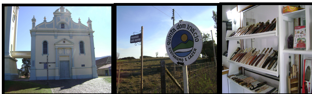
FIGURA 5: ALGUNS ATRATIVOS DA ROTA TURÍSTICA GASTRONÔMICA: PARÓQUIA SÃO PEDRO, QUINTA DOM INÁCIO E FÁBRICA DE FACAS COQUEIRO.

A Rota Turística e Gastronômica de Santa Maria e Silveira Martins tem 46 pontos de visitação entre o distrito de Arroio Grande em Santa Maria e Silveira Martins. A rota possui balneários, mirantes, cascatas, fábricas de facas, cantinas, restaurantes, moinho, museu, igrejas, capelas, monumentos, propriedades especializadas em Turismo rural e ecoturismo (figura 5).