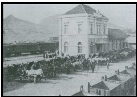
FIGURA 1: INAUGURAÇÃO DA FERROVIA EM 1885. FONTE: KARSBURG, 2007.

Alguns marcos qualitativos, segundo Karsburg (2007), foram significativos para a transformação do espaço de Santa Maria e Silveira Martins como: instalação da ferrovia em 1885 (figura 1) que resultou na modificação comportamental dos homens e seus hábitos alimentares, seus costumes de trabalho e, principalmente, suas relações sociais, conflito Igreja versus Governantes onde a igreja era contra as idéias de progresso e desenvolvimento que os governantes almejavam para Santa Maria, chegada dos imigrantes italianos em Silveira Martins, em 1887, na busca por melhores condições de vida e esperança de prosperar e fazer riqueza.