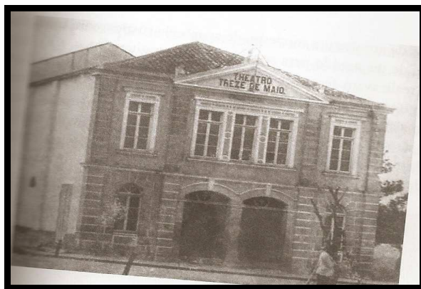
FIGURA 2: TEATRO TREZE DE MAIO EM 1889.

Os municípios de Santa Maria e Silveira Martins sofreram efeitos do processo. No passado, aproximadamente em 1889 (figura 2) os governantes pensaram novas funcionalidades para os espaços, e assim criaram opções para o lazer. O Turismo surgiu em meio às idéias de progresso. Nessa época, ocorreram mudanças na arquitetura das casas, construção de prédios, o teatro Treze de Maio foi construído no lugar da antiga Igreja Matriz, fato que representou a modernidade e a ruptura do poder da igreja. (KARSBURG, 2007)