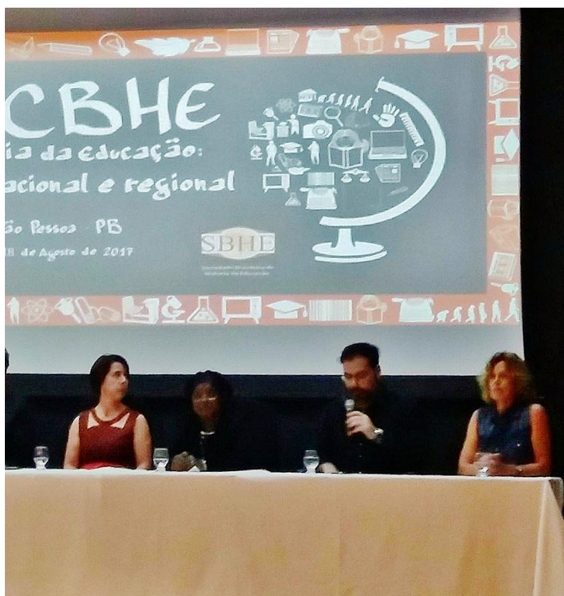
Figura 3 - Representação do GTHE da ANPUH na mesa de abertura do IX CBHE. 15/08/2017.

Por fim, e no que tange novamente a Revista de História e Historiografia da Educação , expressamos a nossa satisfação pela receptividade que temos recebido no que diz respeito ao presente periódico. Apesar de