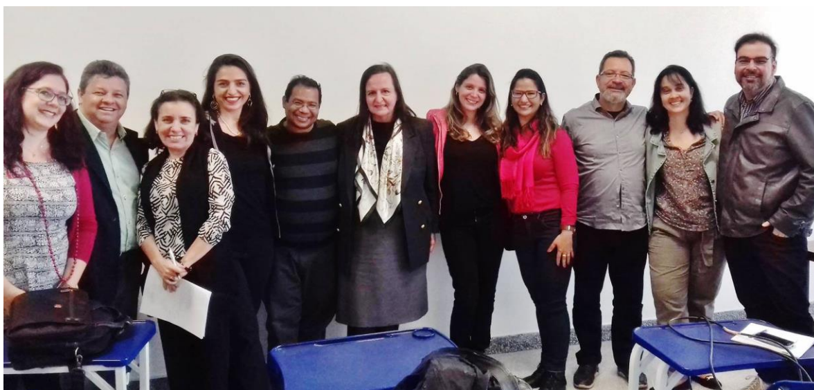
Figura 2 - Coordenadores e alguns dos apresentadores no simpósio temático 47, realizado em Brasília (DF). 28/07/2017.

Ainda sobre a participação do GT de História da Educação da ANPUH em eventos, ocorreu nos dias 15 a 18 de agosto de 2017, na cidade de João Pessoa, nas dependências da Universidade Federal da Paraíba, o IX Congresso Brasileiro de História da Educação. Na ocasião, nosso GT foi gentilmente convidado, na condição de um dos apoiadores do