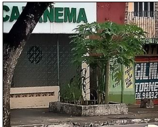
Figura 4. Plantio de mamoeiro realizado na Av. João Paulo II, Capanema-Pará Figure 4. Papaya planting carried out at João Paulo II Avenue, Capanema-Pará

Foi identificado a presença de mamoeiro (Figura 4). Além dos plantios, os mamoeiros surgem de forma espontânea pela cidade por meio da dispersão de sementes realizadas pela fauna.