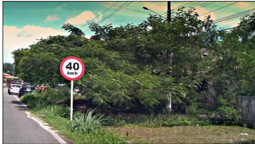
Figura 5. Árvores em conflito com a fiação e o poste de energia Figure 5. Trees in conflict with wiring and power pole

parte aérea, utilizando os galhos de árvores como apoio da fiação. Os conflitos com fios de alta tensão foram ocasionados pela implantação de árvores de grande porte sob fiações de redes de energia e telefone (Figura 5).