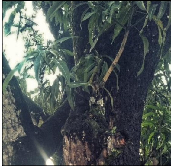
Figura 11. Vegetal com brotações epicórmicas Figure 11. Plant with epicormic sprouts

Este problema pode surgir por má condução da poda. No município em estudo é visto muitos problemas com o processo de urbanização, dentre eles a implantação de quiosques (Figura 5 e 6) em canteiros centrais sem as devidas recomendações, essa implantação gera problemas a arborização, que sofre com podas conduzidas por profissionais incapacitados ou pelos próprios donos de quiosques. A condução equivocada faz com que não ocorra o processo de compartimentalização, dessa forma podem surgir as brotações epicórmicas, estimulando a formação de uma nova copa, causando instabilidades e podendo provocar danos.