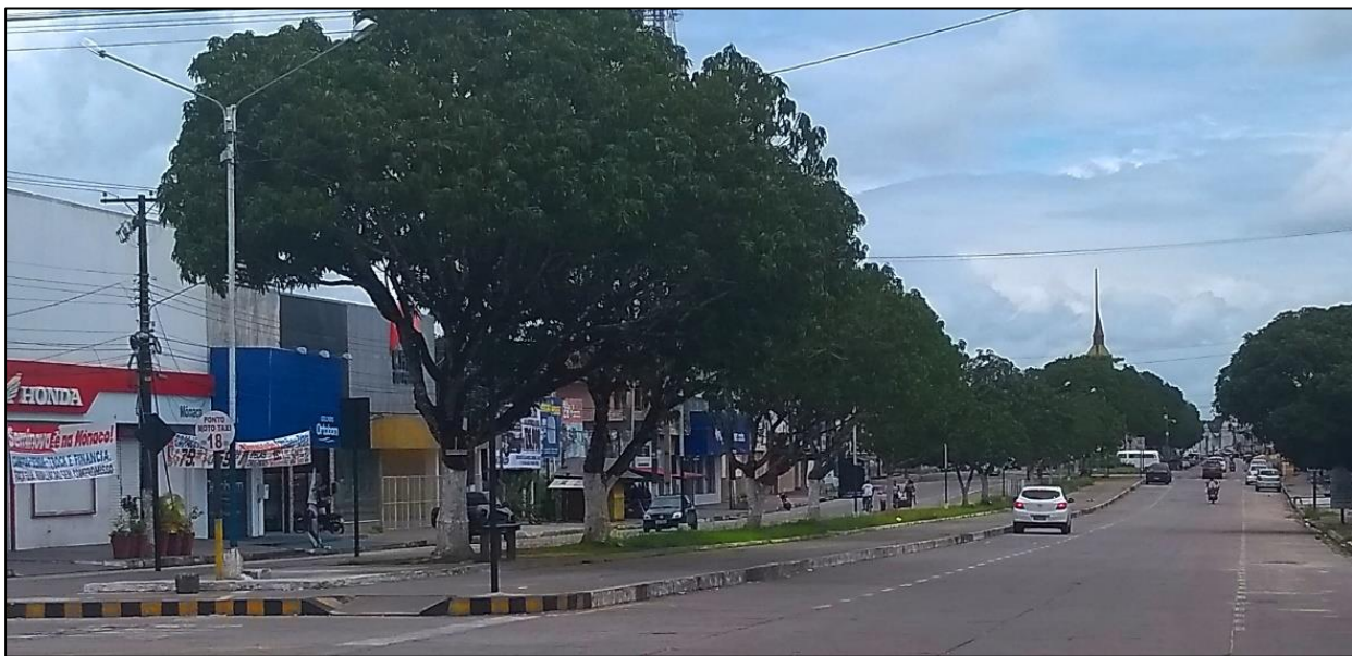
Figura 2. Manguceiras plantadas em canteiro central na Av. Barão de Capanema Figure 2. Mango trees planted in a central island at Barão de Capanema Avenue

Foram catalogados 243 árvores, arbustos e palmeiras, sendo observado um total de 0,82% de plantas arbustivas e 99,17% árvores, e 8 famílias. Em relação à origem das espécies, foi identificado que 81,48% das árvores eram exóticas do Brasil e 18,51% eram nativas do Brasil. As espécies mais expressivas na pesquisa foram: Mangifera indica L. (Figura 2), representando 61,32%, seguido de Ficus benjamina L. com 10,29%, Senna siamea (Lam.) H.S.Irwin & Barneby com 7,41%, Roystonea oleracea (Jacq.) O.F.Cook com 7,00% e Terminalia catappa L. com 4,12% (Tabela 2).