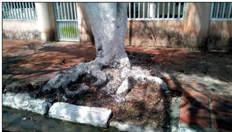
Figura 10. Problemas com afloramento de raízes em um Ipê Figure 10. Problems with root outcrop in an Ipê

Problemas relacionados à afloração das raízes em calçadas ou vias pavimentadas foi identificado em 29,34% dos casos (Figuras 9 e 10), resultado de um planejamento insatisfatório em relação a implantação da vegetação nessas vias. Toda a extensão da Avenida João Paulo II possui problemas com afloração de raízes de mangueiras no canteiro central, o qual, possui menos de 0,5 metro de largura (Figura 10).