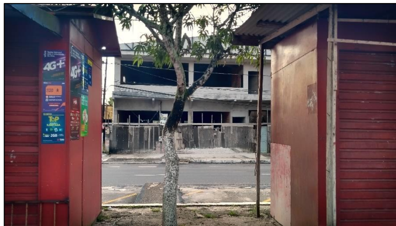
Figura 6. Mangueira plantada entre quiosques no canteiro central da Av. Barão de Capanema, em espaçamento de 1 metro da edificação.

Um das finalidades da poda de elevação é a retirada de galhos que dificultem a passagem de pessoas e veículos pelas vias (PORTO; BRASIL, 2013). No município em estudo, a maioria dos indivíduos vegetais encontram-se em canteiros centrais, e, com o processo desordenado de urbanização no município, houve a implantação de quiosques informais nesses espaços destinados a comercialização de produtos. Para as árvores não oferecem “riscos” a esses quiosques, a prefeitura municipal realiza podas de levantamento sem apoio nas recomendações técnicas (Figura 6).