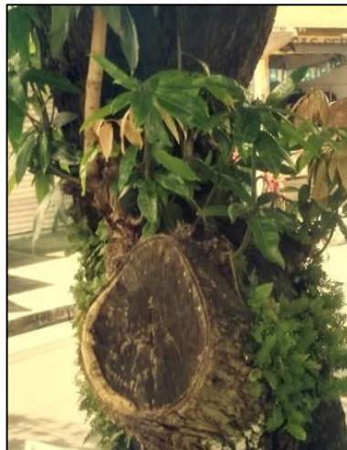
Figura 8. Problemas com compartimentalização em árvores

O estado do tronco se mostrou íntegro na maioria dos casos (85,59%), não apresentando danos físicos ou fitossanitários, porém, problemas relacionados a vandalismo (6,99%) e problemas com poda (compartimentalização) (4,11%) foram identificados em algumas das árvores (Figura 8).