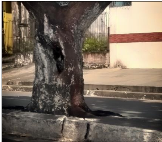
Figura 9. Árvores com o tronco oco na Avenida João Paulo II Figure 9. Trees with hollow trunk at João Paulo II Avenue

Além disso, foi identificado uma árvore com tronco oco (Figura 9), e problemas com ramos codominantes (3,70%).