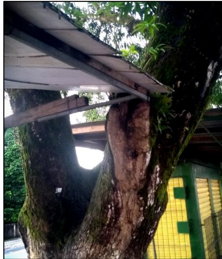
Figura 7. Mangueira plantada em canteiro central na Av. Barão de Capanema, com tronco fornecendo apoio a estrutura de um quiosque.

uma mangueira com poda realizada de forma inapropriada para fornecer espaço ao quiosque localizado de forma irregular no canteiro central.