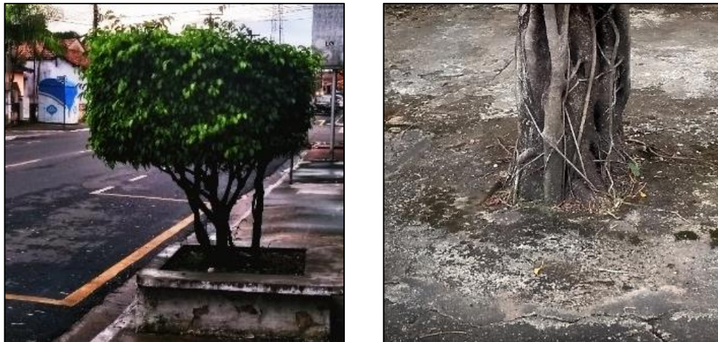
Figura 3. (a) Fícus com técnicas de topiaria. (b) Fícus com aplicação de técnica empírica de pavimentação.

Na Figura 3a é possível observar a espécie localizada na Av. João Paulo II, onde é possível notar técnicas de topiaria, característica que estimula o uso desta espécie. Na figura 3b foi utilizado a técnica empírica de pavimentação da calçada para conter os danos ocasionados pelas raízes. A falta de diretrizes na legislação do município de Capanema-Pará acaba abrindo precedentes para que continuem utilizando a espécie em vias inapropriadas para o seu plantio.