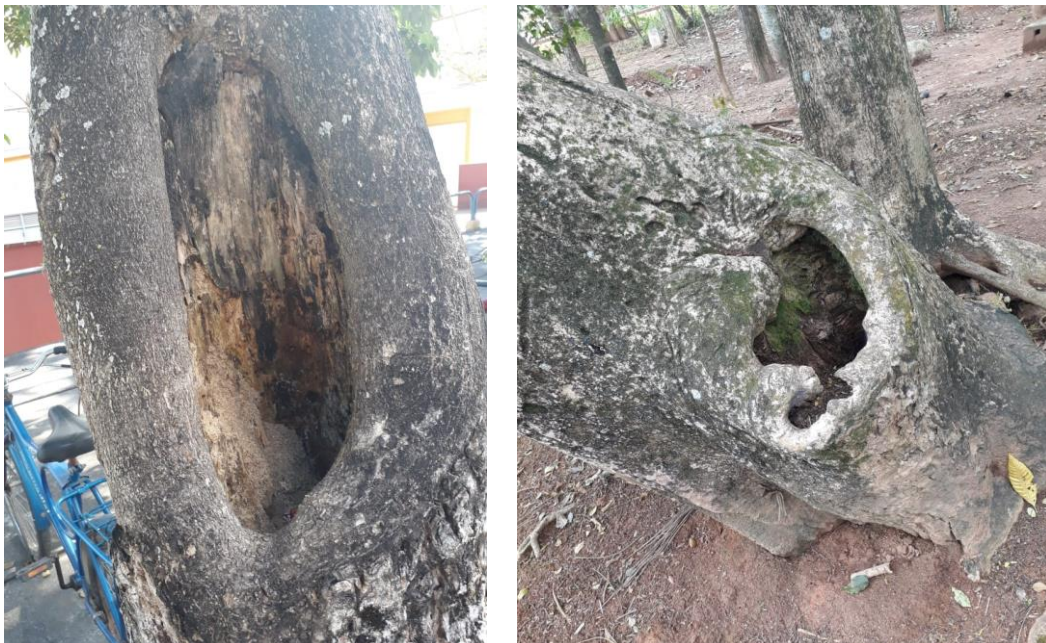
Figura 2. Cavidades observadas no tronco de Spathodea campanulata localizadas no campus da UFV Figure 2. Cavities observed in the trunk of Spathodea campanulata located on the UFV campus

Outro fator que influenciou no potencial de falha foi a presença de cavidades, sendo que ao todo 6 indivíduos apresentaram cavidades. Nessas condições as árvores ficam susceptíveis a biodeterioração do lenho por microrganismos xilófagos, cupins e brocas da madeira, podendo ocasionar, na maioria das vezes, a sua queda ou morte (COSTA-LEONARDO, 2002). Esta característica contribuiu significativamente para a categorização dos indivíduos na classe de maior risco (Figura 2).