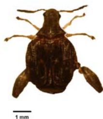
Figura 1. Adulto de Pygiopachymerus lineola (Chevrolat, 1871) (Coleoptera: Chrysomelidae: Bruchinae), encontrado atacando sementes de Cassia fistula L (chuva-de-ouro). em Santa Maria, RS. Setembro e outubro de 2010

Pygiopachymerus lineola (Chevrolat, 1871) (Coleoptera: Chrysomelidae: Bruchinae), possui a característica de se desenvolver no interior das sementes, e emergir após atingir o estágio adulto. Em um estudo realizado por Ribeiro-Costa e Costa (2002), sobre a postura de Pygiopachymerus lineola em Cassia leptophylla , as autoras verificaram que os ovos são depositados pela fêmea sobre as vagens e a postura consiste de três ou mais ovos, distribuídos de forma aleatória na superfície da vagem, sendo observadas em alguns casos, posturas em áreas com o tegumento ligeiramente danificado. Seu ciclo de vida, em condições de laboratório predando Cassia javanica L., segundo Carvalho e Figueira (1999) é de 58,4 \pm 9,18 dias.