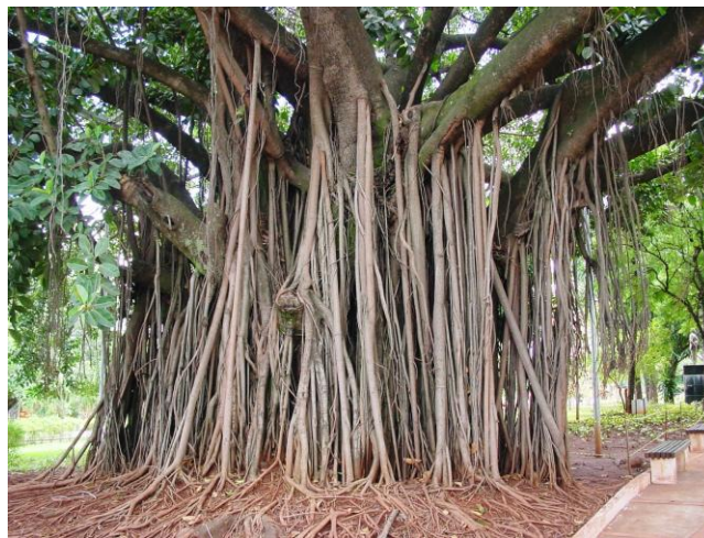
Figura 2. Ficus elastica (falsa-seringueira), na Praça da República (“Praça do Rádio Clube”) Figure 2. Ficus elastica (Indian rubber tree), in Praça da República (“Praça do Rádio Clube”)

Espécies como Bauhinia variegata , Caesalpinia peltophoroides , Eugenia uniflora , Ficus elastica (Figura 2), Licania tomentosa , Magnolia champaca , Mangifera indica , Nerium oleander , Plumeria acutifolia e Terminalia catappa são muito comuns na arborização urbana brasileira (BACKES e IRGANG, 2002; ENERSUL, 2005; MACHADO et al., 1992; PRANCE, 1975; TAMASHIRO e SARTORI, 1999). Porém, outras espécies como Calycophyllum multiflorum , Cariniana estrellensis , Cecropia pachystachya , Guarea guidonia , Inga laurina , Syzygium cumini e Thevetia peruviana , são de uso incomum.