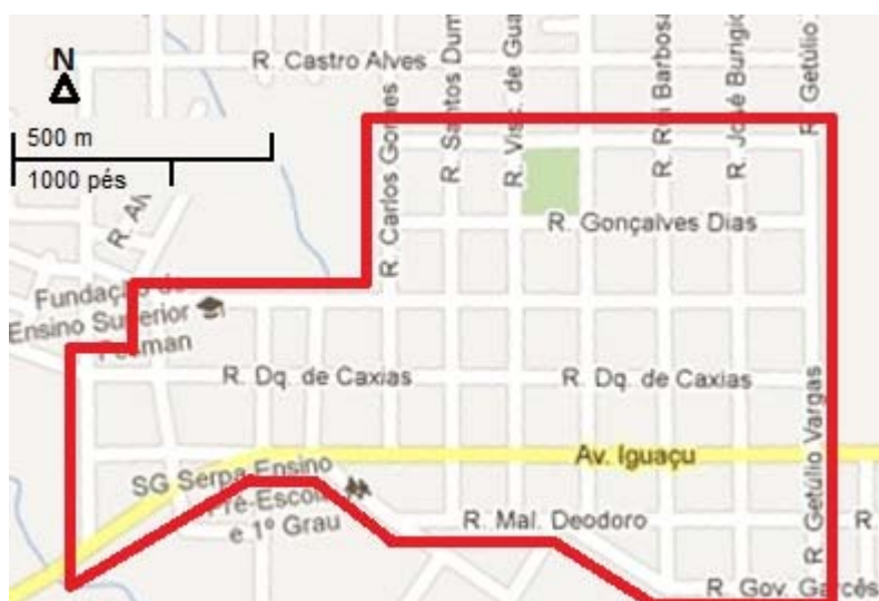
Figura 1. Área delimitada por traço em vermelho compreendendo as vias urbanas estudadas.

O estudo foi realizado na região central do Município, em 19 ruas (Barão do Rio Branco, Dom Pedro II, Duque de Caxias, Carlos Gomes, Getúlio Vargas, Gonçalves Dias, Governador Garcês, Hugo Vieira, José Bonifácio, José Burigo, Juscelino Kubitschek, Marechal Deodoro, Marcílio Dias, Pedro Álvares Cabral, Rui Barbosa, Saldanha Marinho, Santos Dumont e Visconde de Guarapuava), e em duas avenidas (Iguaçu e Souza Naves), totalizando 21 vias urbanas (Figura 1).