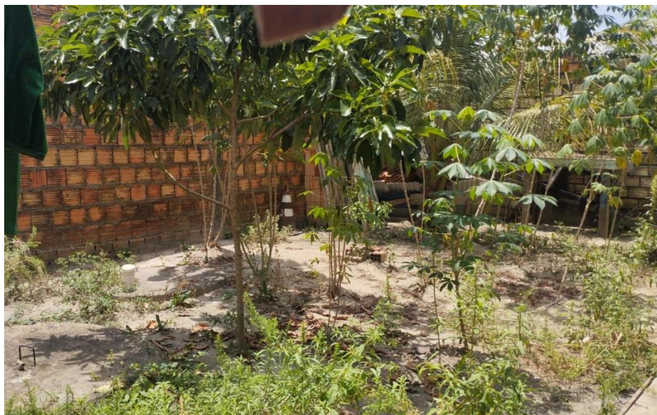
Figura 2. Exemplo dos quintais agroflorestais urbano no residencial Santa Benedita, cidade de Altamira-PA.

A pesquisa foi conduzida em 22 quintais agroflorestais urbanos, utilizando a técnica de amostragem não probabilística por conveniência e conforme a anuência dos proprietários ou responsáveis legais. Para este estudo, o inventário considerou apenas as árvores, arbustos, palmeiras, lianas, bananeiras e mamoeiros (Figura 2).