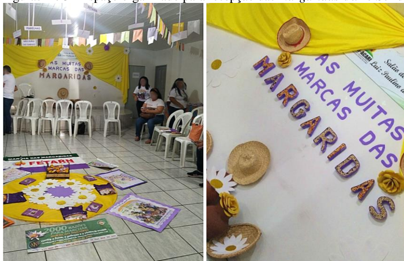
Figuras 2 e 3 - Espaço organizado para recepção das margaridas do/no Seridó

anteriores, quanto aquelas que iriam marchar pela primeira vez, são residentes em sítios, fazendas e assentamentos e têm como principal fonte de renda o trabalho desenvolvido no campo. Na ocasião, o ambiente do Sindicato dos Trabalhadores e Trabalhadoras Rurais do município de Acari tomou a forma e as cores das margaridas, como ilustra as imagens abaixo, nas quais podemos observar as circunstâncias físicas onde as interações sociais foram estabelecidas entre as participantes a partir dos textos multimodais a serem debatidos, tal como propõe Hamilton (2000).