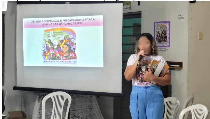
Figura 5 - Apresentação de cartilhas e orientações gerais para a Marcha das Margaridas 2023