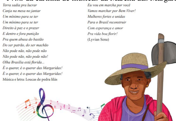
Figura 10 - Print da cartilha de músicas da Marcha das Margaridas 2023

contribuiu para a discussão dessas temáticas, dessa vez de modo poético/lúdico. Trata-se da cartilha de músicas da Marcha das Margaridas 2023 (figura 10), igualmente disponibilizada na internet para conhecimento geral e possível auxílio durante a entoação das letras na Esplanada dos Ministérios, na manifestação.