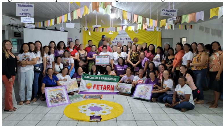
Figura 1 – Participantes do evento regional das margaridas do/no Seridó

Na região do Seridó, interior do estado do Rio Grande do Norte, um desses eventos, promovidos em preparação para esse movimento, em 2023, aconteceu no dia 06 de junho do referido ano. Os participantes desta ação, intitulada de oficina, constituíram-se predominantemente de mulheres (figura 1), com exceção de alguns representantes de órgãos estaduais vinculados ao meio agrário.