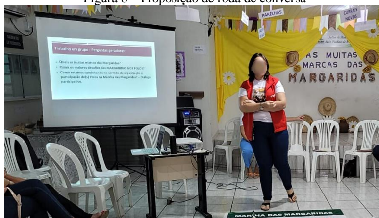
Figura 8 – Proposição de roda de conversa

Além desses, outros questionamentos semelhantes, que incluíam temáticas de igual relevância, também foram propostos (figura 8), de modo a serem discutidos em pequenas rodas de conversa (figura 9) e, posteriormente, verbalizados na coletividade, em diálogo participativo.