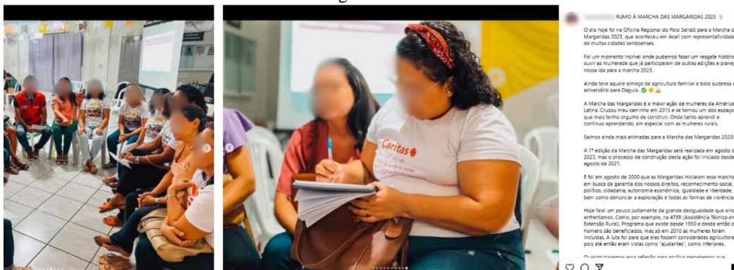
Figura 9 – Roda de conversa