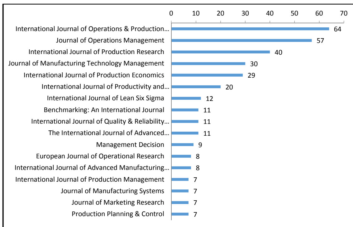
Gráfico 01: Referências dos artigos por periódico

A análise bibliométrica das referências dos 24 artigos que compõe o portfólio Bibliográfico foi realizada em 603 artigos. As referências bibliográficas foram publicadas em 171 periódicos. Deste total, 17 periódicos concentram 338 publicações, ou seja 56% do total, apresentados no gráfico 01.