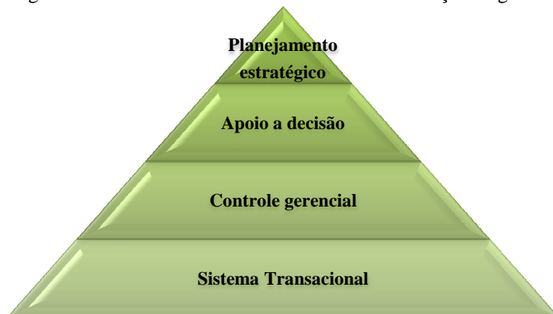
Figura 1 - Funcionalidade de um sistema de informações logística