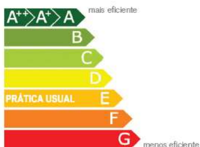
GRÁFICO 2: NÍVEIS DE DESEMPENHO GLOBAL

A contabilização por vertentes posiciona como mais relevante os recursos com 32% do peso, seguido da vivência socioeconômica (19%), conforto ambiental (15%), integração local (14%), cargas ambientais (12%) e por fim a gestão ambiental (8%) do edificado.