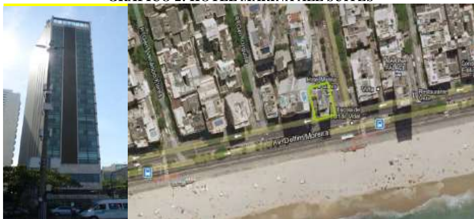
GRAFICO 2: HOTEL MARINA ALL SUITES

O Hotel Marina All Suites possui 19 pisos de altura, e conta com 39 suítes, uma sala executiva, um espaço lounge, uma web room, um home theater, um fitness center, uma sala de massagens, uma piscina interior, uma sauna, um restaurante, um bar, um serviço de lavanderia e uma zona de recepção e manutenção. Totalizando uma área bruta de 3599m 2 de construção, (GALÃO, 2013).