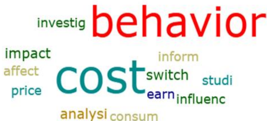
Figura 1: Nuvem dos principais termos referentes aos títulos dos artigos.