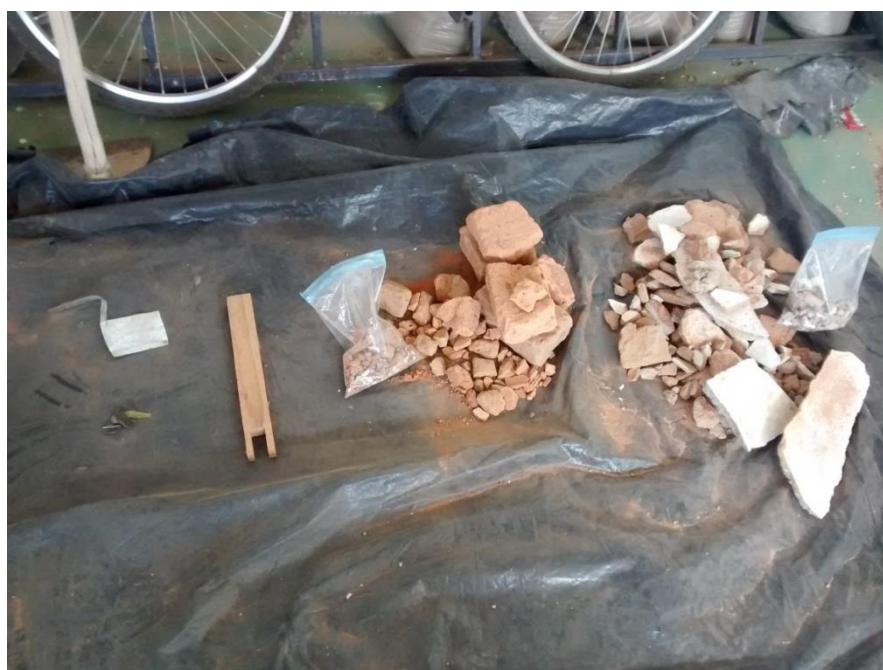
Figura 02- classificação dos materiais- Materials classification

A classificação foi realizada por catação, consistiu na pesagem da amostra total e na separação em concreto e argamassa, cerâmica, solo e em outros materiais (madeira, metal, plástico e papel), como na figura 2.