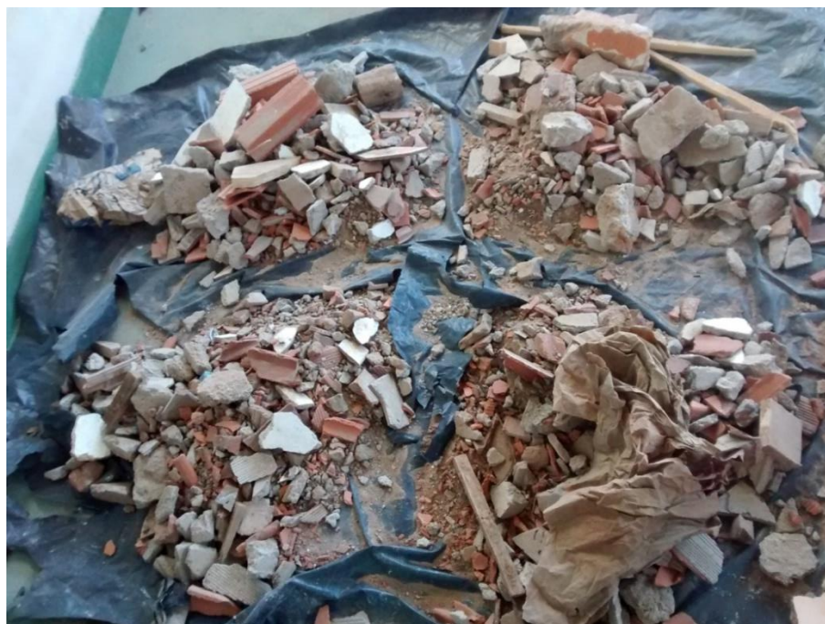
Figura 01- Amostra representativa- Representative sample

A classificação foi realizada por catação, consistiu na pesagem da amostra total e na separação em concreto e argamassa, cerâmica, solo e em outros materiais (madeira, metal, plástico e papel), como na figura 2.