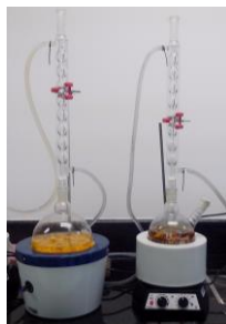
Figura 1. Extração dos óleos de macaúba e dendê (da esquerda para a direita)

Primeiramente, foram realizadas separadamente, as extrações dos óleos da polpa do coco macaúba e da polpa do dendê por meio da utilização do solvente orgânico hexano, sob refluxo por 12 horas. Após a extração, realizou-se filtração e evaporação em rotaevaporador para a recuperação do solvente e obtenção dos óleos. A Figura 1 mostra os processos de extração dos óleos de macaúba e dendê.