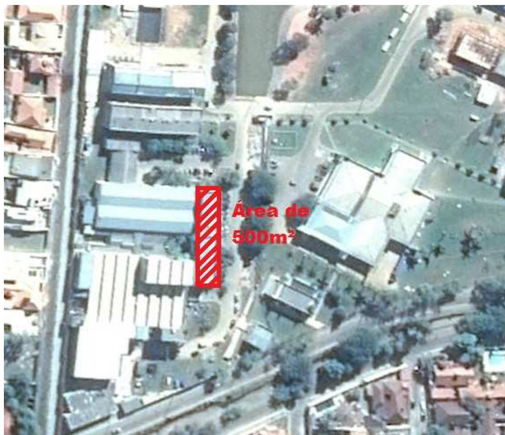
Figura 2: Área de captação do IRN

A imagem apresentada na figura 2 representa a área de captação e foi obtida através do software Google Earth, desenvolvido pela empresa Google.