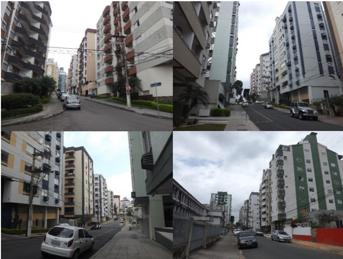
Figura 01 - Imagens de ruas do bairro Comerciário, as quais caracterizam a sua verticalização.

A Figura 1 nos mostra o perfil de quatro ruas existentes no bairro Comerciário, possibilitando-nos perceber a grande quantidade de edifícios residenciais existentes na área.