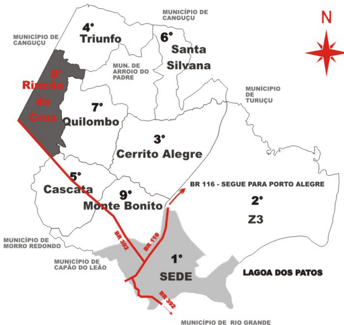
FIGURA 02 - REPRESENTAÇÃO DO MUNICÍPIO E LOCALIZAÇÃO DO DISTRITO DE RINCÃO DA CRUZ REPRESENTACIÓN DE LA CIUDAD Y LOCALIZACIÓN DEL DISTRICTO DE RINCÃO DA CRUZ