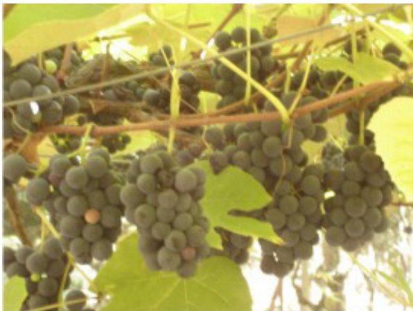
IMAGEM 9 - UVAS NO PARREIRAL UTILIZADAS PARA PRODUZIR VINHO DOS DESCENDENTES DE IMIGRANTES ITALIANOS