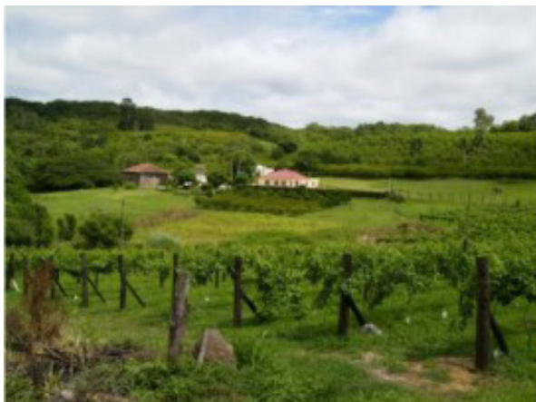
IMAGEM 11- ASPECTOS DA PAISAGEM COLONIAL – OS PARREIRAIS