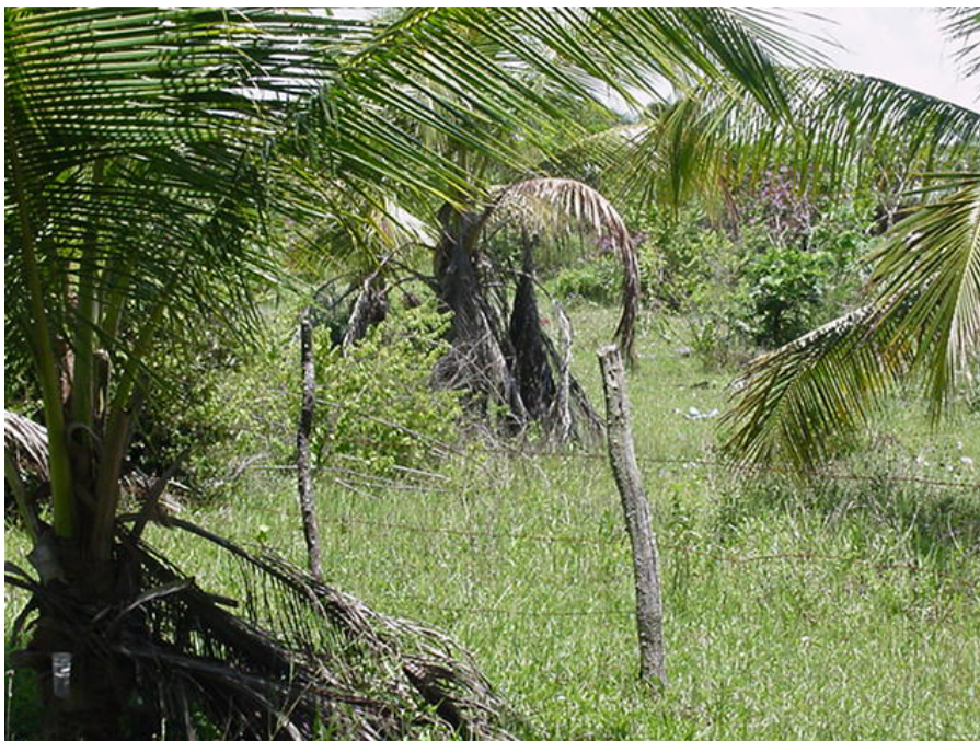
Figura 02: Amplitude de Abrangência das Copas do Coqueiro – Idéia do Montante Gerado.

No que diz respeito à geração de resíduos, na forma de cascas, foram identificadas formas diferenciadas em termos de intensidade de poluentes. Nas fazendas que comercializam o coco ainda em estado de maturação primário, ou seja, “verde”, não ocorrem problemas com as cascas, no entanto as de coco seco, além das palhas apresentam tais materiais como resíduos. Os resíduos do coco verde são transferidos para os pólos de consumo, e serão abordados no decorrer do trabalho.