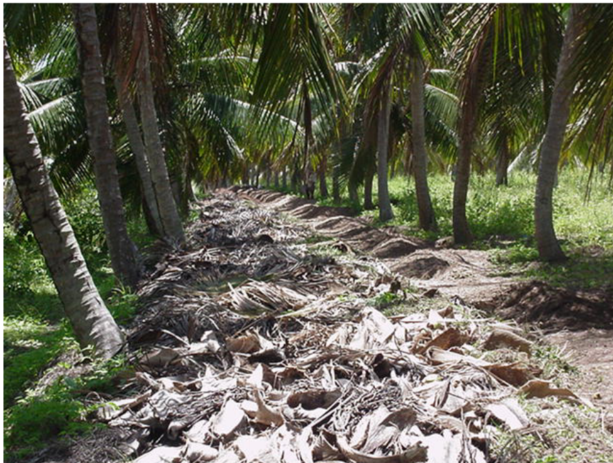
Figura 01: Utilização de Palhas de Coqueiros na Adubação destes.

Os resultados obtidos mostram que nas fazendas produtoras há geração de um grande montante de resíduos provenientes das folhas dos coqueiros, que são aproveitados como adubo no próprio plantio. No entanto, esse montante, apesar da forma usual de reaproveitamento ocupa uma área considerável, pois não há compactação do material. Nas Figuras 1 e 2 são mostradas algumas ilustrações onde podem ser visualizadas de forma mais objetiva essa questão: