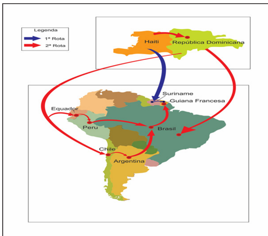
Figura 1 - Principais rotas da imigração haitiana para a Guiana Francesa no século XXI

Na capital do estado do Amapá, Macapá, foi constituído um nó importante da rede migratória haitiana, servindo como suporte do fluxo em direção à GF, uma vez que haitianos fixados na cidade oferecem hospedagem solidária aos recém-chegados, vindos diretamente de seu país de origem, da República Dominicana ou de algum país sul-americano, tais como: Equador, Peru, Chile e Argentina (Figura 1). Os coparticipantes da rede migratória em Macapá mantém contato com os participantes da diáspora através de redes sociais como Facebook, WhatsApp, Twitter, Skype ou ligação direta de celular.