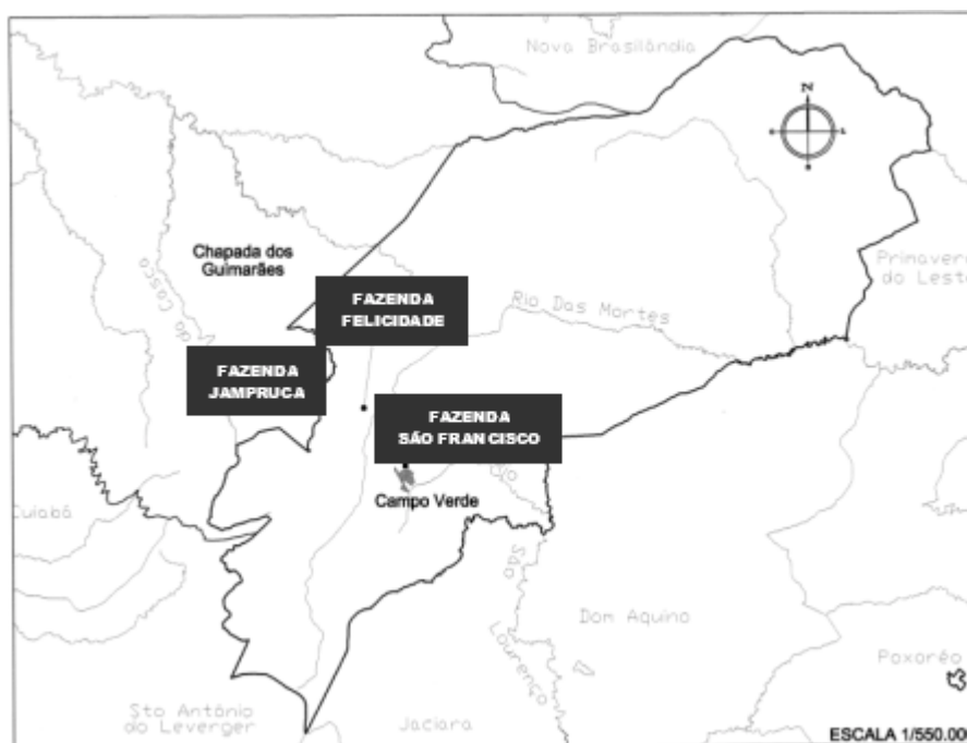
FIGURA 1 - MAPA DO ESTADO DO MATO GROSSO, DESTACANDO OS MUNICÍPIOS DE CAMPO VERDE E CHAPADA DOS GUIMARÃES

■ Fazendas que serviram para coleta com o respectivo posicionamento global por satélite fuso 21 (gps): fazenda São Francisco (696214E;8280948N), fazenda Felicidade (690267E; 8290086N), fazenda Jampruca (679345E; 8293579N).