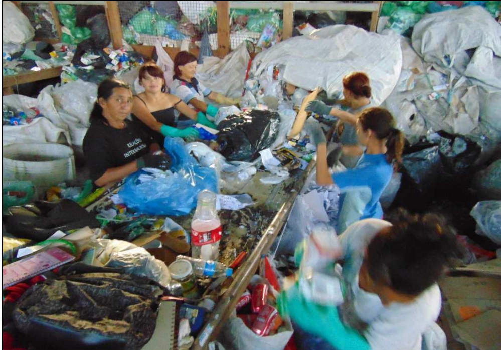
Figura 2. Catadoras de uma cooperativa de reciclagem - abr. 2015

certa margem de garantias de pertencer a um coletivo (formal ou informal) e aplacar possivelmente algumas de suas incertezas advindas da sociedade complexa em que vivem.