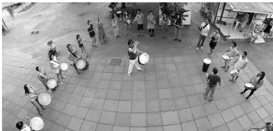
Figura 1: Espaço de ensaio do Arrasta Ilha e a Banca de Arte-Ocupação (Fonte: Marcelino, 2014, p. 102)

Nesse período de observação foram classificadas três dinâmicas gerais das atividades do grupo: os ensaios, as oficinas e as apresentações. Os ensaios são realizados aos domingos das 15 às 19 horas, geralmente estendendo para uma reunião até às 20h. O grupo ensaia dentro da UFSC, próximo ao Centro de Convivência, ao lado da Banca de Arte-Ocupação, onde o grupo guarda os instrumentos (Figura 1).