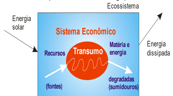
FIGURA 3 – A economia-atividade como sistema aberto dentro do ecossistema ( visão ecológica da economia ).