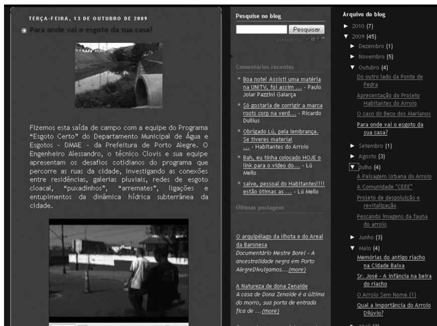
FIGURA 5 – POSTAGEM NO BLOG DO PROJETO – ENTREVISTA COM TÉCNICOS DO PROGRAMA ESGOTO CERTO – DMAE – PREFEITURA DE PORTO ALEGRE PONTO.