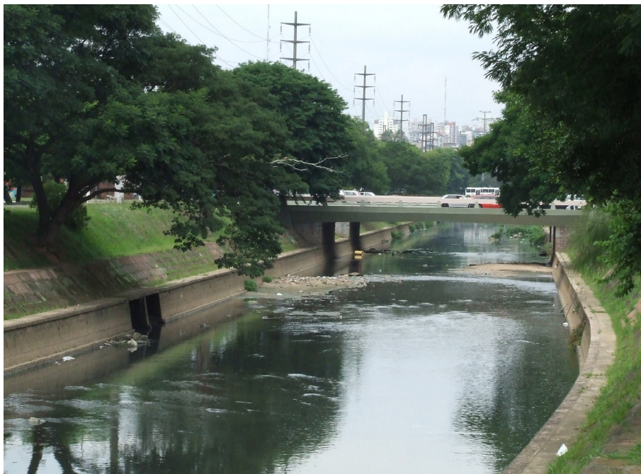
FIGURA 2 – ARROIO DILÚVIO. PONTE AVENIDA ÉRICO VERÍSSIMO E AV. IPIRANGA – 2009. AUTOR: LUNA CARVALHO (BIEV-PPGAS-UFRGS).

cesso de urbanização da cidade, a associação dos arroios a esta propriedade de delimitação de fronteiras. No caso das ocupações irregulares, o processo de ocupação da margem implica no aterramento de parte da margem, redesenhando a relação do solo com a água, cujo contraponto é a luta contra a ação devoradora da água na constante reconstrução de pontes de acesso, no reforço da “barranca” do leito do arroio com sacos de areia, no cultivo de espécies vegetais que “segurem” o solo. As narrativas dos engenheiros envolvidos na grande canalização do arroio nos anos 1950 e as imagens de acervo que encontramos seguem, numa escala muito maior, a mesma perspectiva de “domar” o arroio, conquistar e controlar sua ação sobre o solo e desenhar os itinerários da cidade.