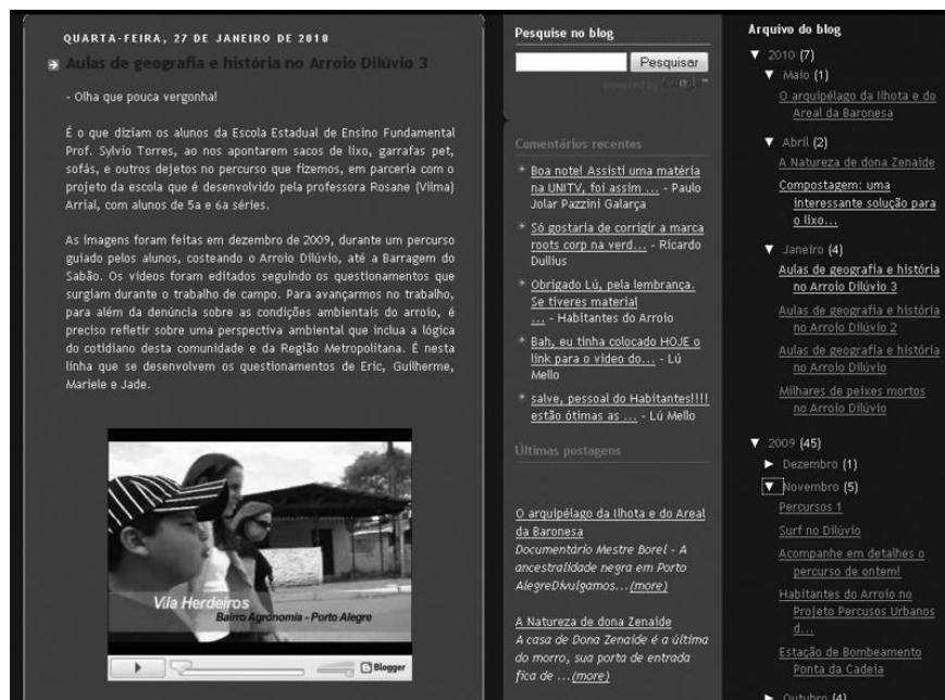
FIGURA 3 – TELA DO BLOG DO PROJETO – POSTAGEM DO PERCURSO COM CRIANÇAS E PROFESSORES EM COMUNIDADE À BEIRA DO ARROIO DILÚVIO.