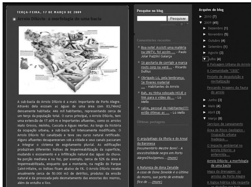
FIGURA 4 – POSTAGEM NO BLOG DO PROJETO – A MORFOLOGIA DA BACIA DO ARROIO DILÚVIO, PUBLICADA NO ATLAS AMBIENTAL DE PORTO ALEGRE.