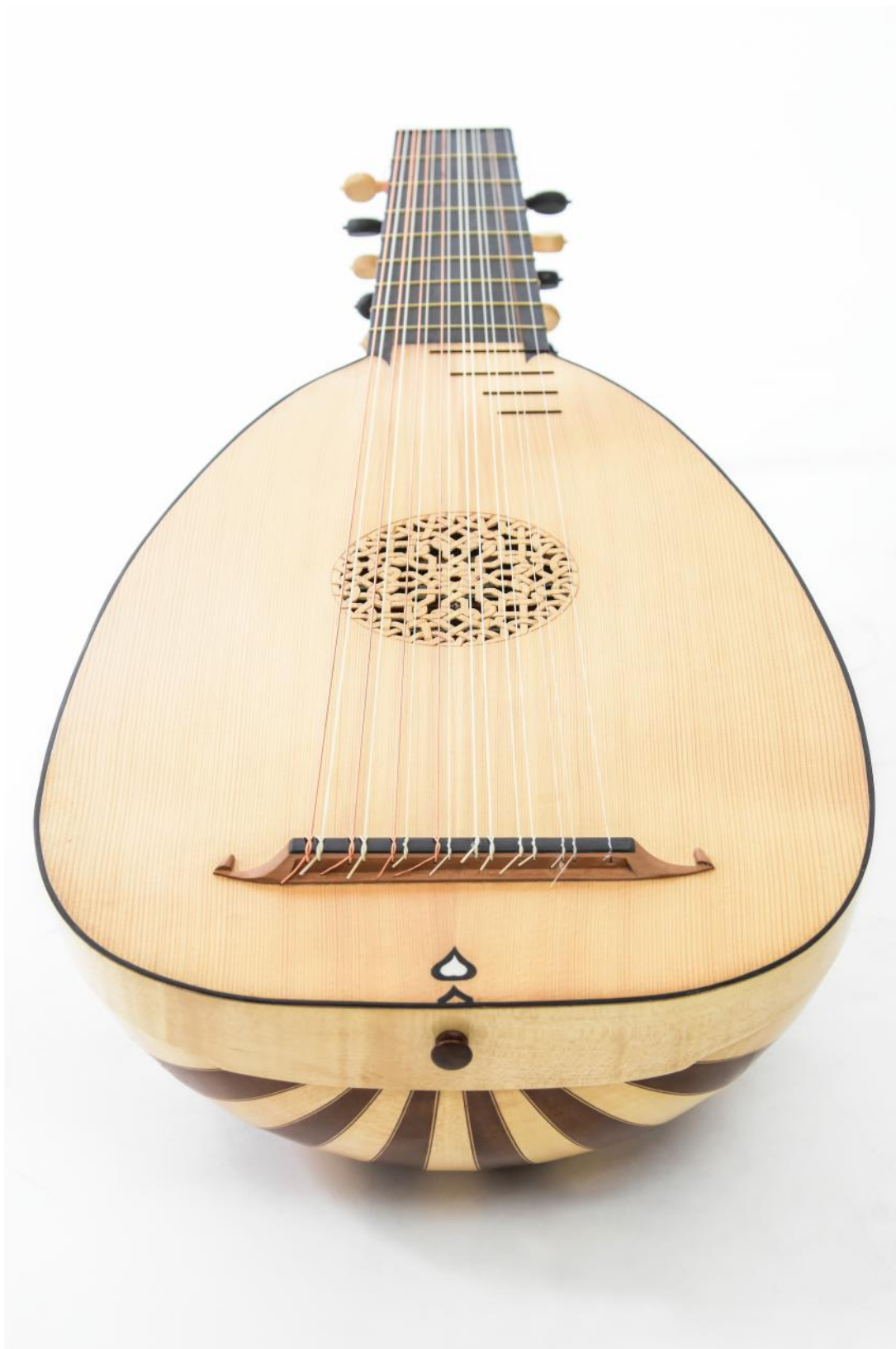
FOTO 05 - PERSPECTIVA