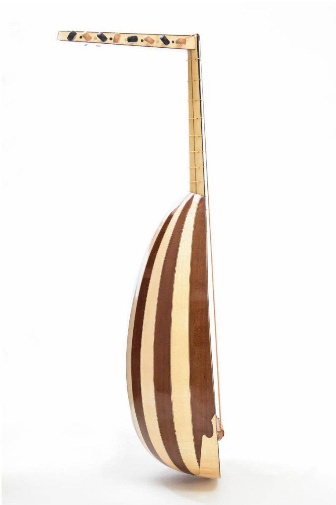
FOTO 02 - VISTA LATERAL