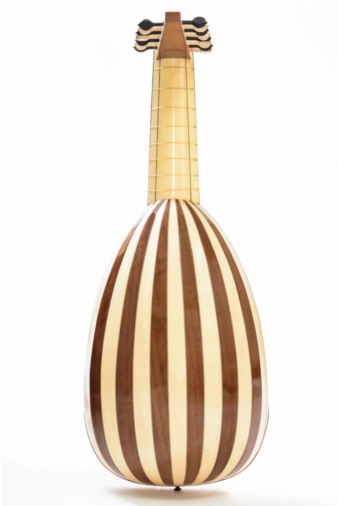
FOTO 03 - VISTA TRASEIRA