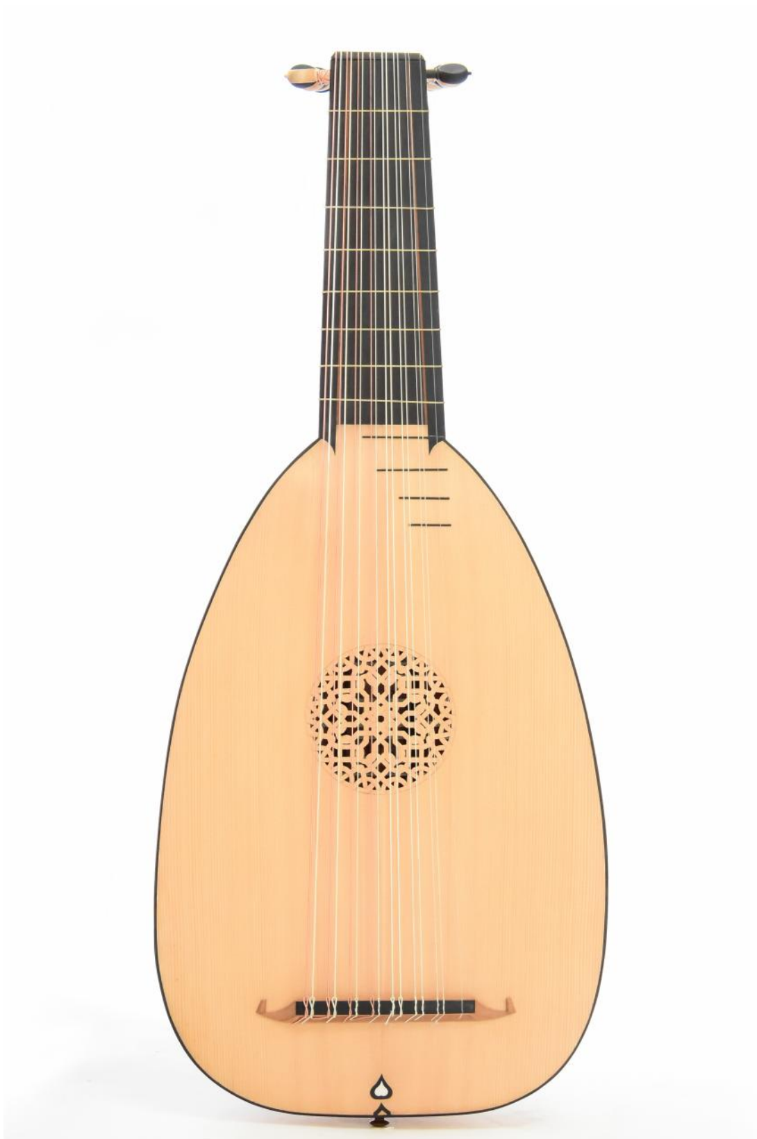
FOTO 01 - VISTA FRONTAL