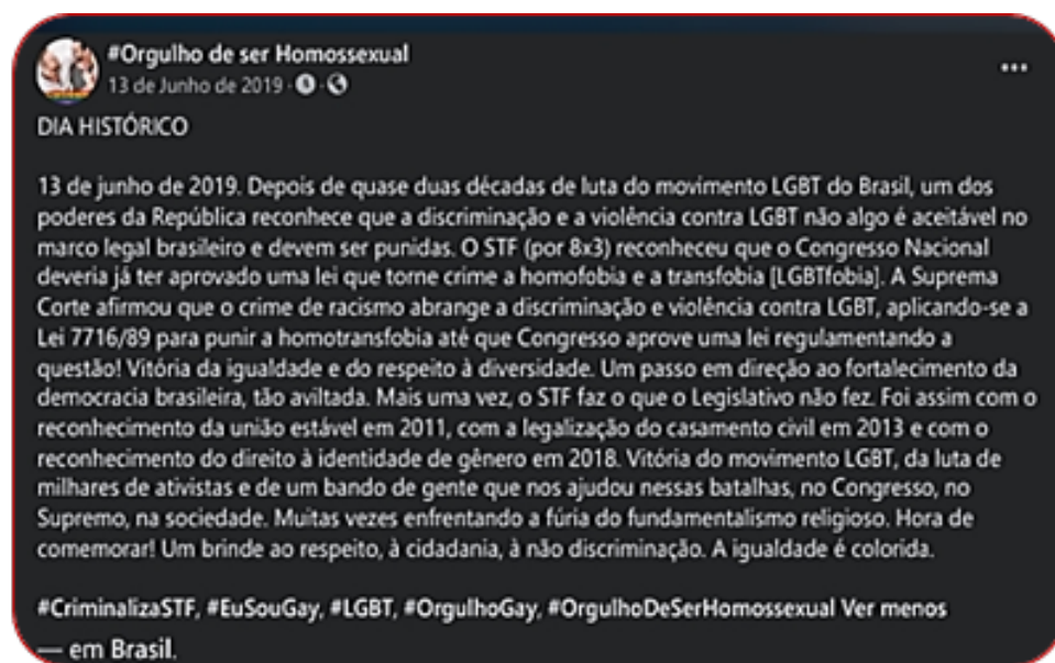
Figura 1 – sdr

É tendo em vista essa questão – somente formulável mediante sucessivos movimentos de idas e vindas ao horizonte complexo de materiais estruturantes da discursividade comemorativa de direitos – que exponho, a seguir, um gesto analítico com o qual tento regionalizá-la no tecido do presente. Meu gesto se baseia no estatuto em relação a da seguinte sequência discursiva de referência (sdr):