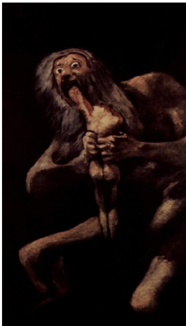
Saturno devorando a su hijo, de Francisco Goya | Museu do Prado | Madri