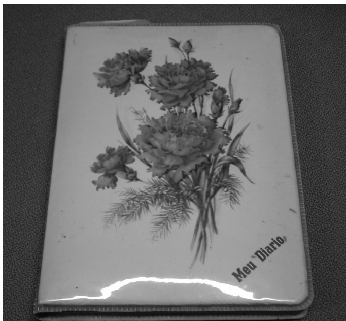
FIGURA 2 – DIÁRIO DE CL.