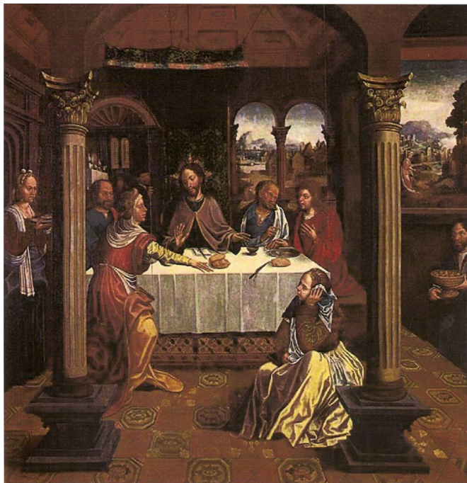
FIGURA 3 – GASPAR VAZ – CRISTO EM CASA DE MARTA . CERCA DE 1535. VISEU, MUSEU DE GRÃO VASCO.

exemplo, a compilação de receitas de Francisco Borges Henriques (1715-1729) foi reveladora da existência de uma significativa bateria de cozinha. Além de forno, fogão e fogareiro, contam-se agulhas de colchões, alfinetes, alguidares, almofarizes, azados, bacias, bacias vidradas, batedores, boiões, boiões vidrados, cafeteiras, canivetes, carretilhas, cestos, xícaras, chocoladeiras, colherões, colheres, colheres de prata, colheres de ferro, covilhetes, cutelos, escumadeiras, espetos, facas, farpinhas agudas de dois gumes, frigideiras, frigideiras vidradas, funis, garrafas, garfos, graís, guardanapos, joias, linhas, moinhos, palanganas, palhas de junco, panelas, panelinhas, panelinhas vidradas, palhinhas, panos, papéis diversos, paus de estender,