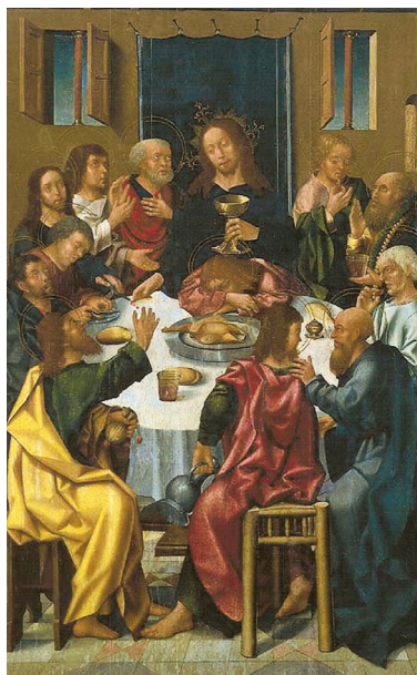
FIGURA 2 – FRANCISCO HENRIQUES EM PARCERIA COM VASCO FERNANDES – ÚLTIMA CEIA (1501-1506). VISEU, MUSEU DE GRÃO VASCO.

A arqueologia também fornece dados de muito interesse. Por exemplo, conhece-se bastante olaria comum produzida em Montemor-o-Novo, durante o século XVI. Efectivamente, no convento de São Domingos daquela localidade foram encontradas peças de diferentes tipologias, a saber: alguidares, asados, atanores, barris, caçoulas, fogareiros, infusas, panelas, pias de cântaros, potes de adega, pucarinhos, quartas, talhas, tarros, tigelas e tachos 31 .