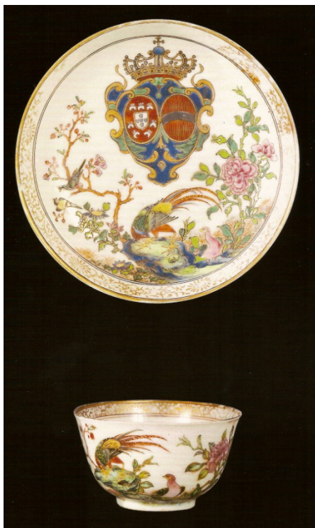
FIGURA 8 – TAÇA COM PIRES. PORCELANA CHINESA DE ENCOMENDA, DINASTIA QING 1720-1740. LISBOA, MUSEU NACIONAL DE ARTE ANTIGA.