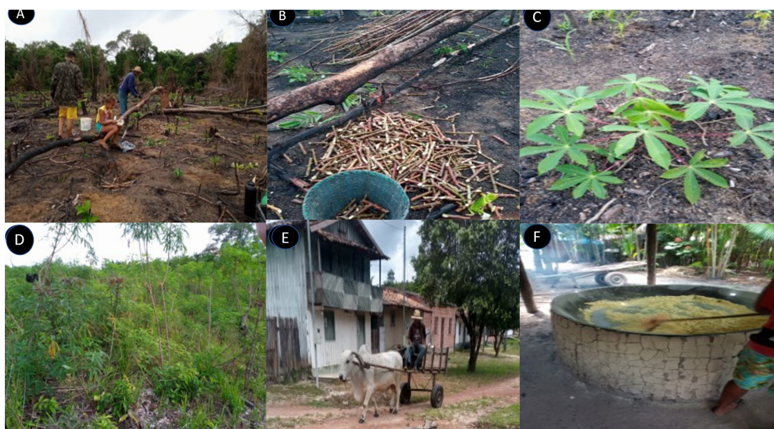
Figura 2 – A, B, C e D, roças manejadas em Porto Alegre/E, transporte de mandioca/F, produção de farinha de mandioca na comunidade quilombola de Porto Alegre, Cametá, Pará.

apenas uma fonte de alimento básica, mas também um motivo de identidade cultural e orgulho para os moradores, sendo a principal geradora de renda de 91% dos entrevistados. A produção de farinha é destinada tanto para a venda quanto para o consumo, estando em praticamente todas as refeições. Katz (2021), analisando um compilado de pesquisas no norte da Amazônia, inferiu que a base dos sistemas alimentares de comunidades tradicionais dessa região são a mandioca e o peixe.