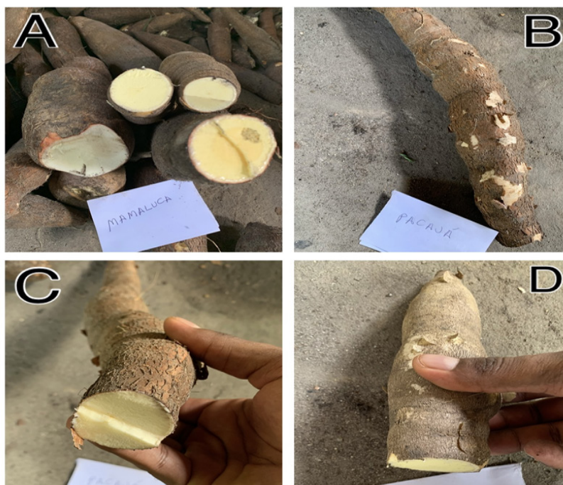
Figura 3 – Etnovariedades das mandiocas mais representativas na comunidade quilombola de Porto Alegre em Cametá, Pará. A: Mamaluca / B: Pacajá / C: Siúba / D: Tucumã.

As roças em Porto Alegre exibem uma variedade significativa de etnovariedades de mandioca em comparação com os padrões observados na região amazônica. Por exemplo, no quilombo do Tambor (AM) foram identificadas 24 etnovariedades de maniva (FARIAS JÚNIOR, 2011); no quilombo de Marudá (MA), 19 etnovariedades (BERNARDES, 2014); e no quilombo de Abacatal (PA), 15 etnovariedades (ARAÚJO et al., 2019). Em média, cada entrevista mencionou seis etnovariedades, com duas a quatro etnovariedades diferentes por roça. Entre as 27 etnovariedades identificadas, as mais representativas foram Mamaluca, Pacajá, Siúba, Tachí e Tucumã, conhecidas por proporcionar uma maior quantidade de polpa nos tubérculos, o que é ideal para a produção de farinha de mandioca.