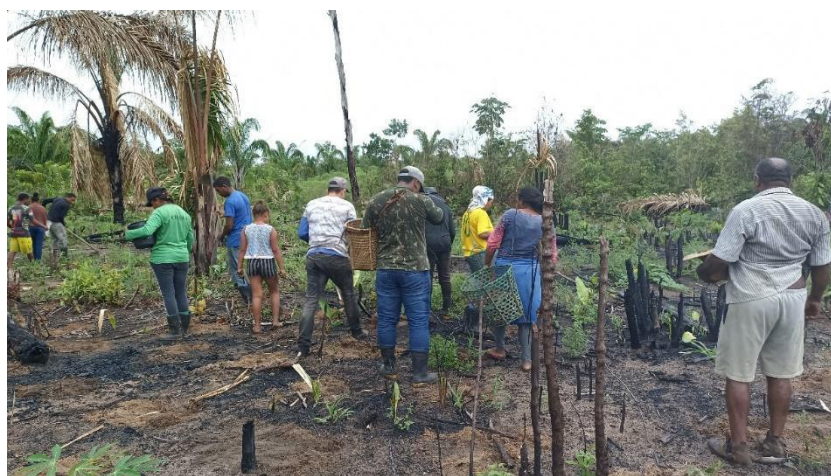
Figura 5 – Convidado de plantio realizado por moradores da comunidade quilombola de Porto Alegre, Pará.

o grupo retorna no período da tarde, e também é oferecido um jantar ao final do dia. Nesses momentos, histórias, alegrias e memórias dos quilombolas são compartilhadas, seguindo adiante essa modalidade de trabalho coletivo que se materializa no processo de plantio da mandioca, mesmo com reajustes na estrutura organizacional das gerações presentes nessa prática de reciprocidade, como pode ser observado na figura a seguir.