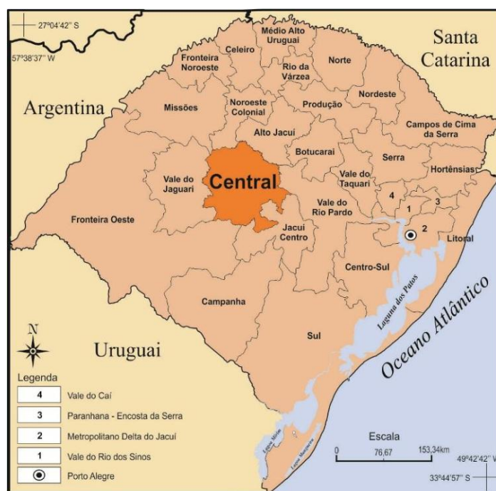
Figura 01: Localização do COREDE Central no Rio Grande do Sul.

Tendo em vista o objeto de análise desta pesquisa, a dinâmica econômica e demográfica da região do COREDE Central do Rio Grande do Sul, localizado na figura 01, a seguir, segundo a forma de produção no meio rural dos municípios, compreende que as relações globais influenciam na forma como se produz na região, especialmente se for considerado o agronegócio, que possui fortes relações com o mercado global e com os meios de produção apresentados por este.