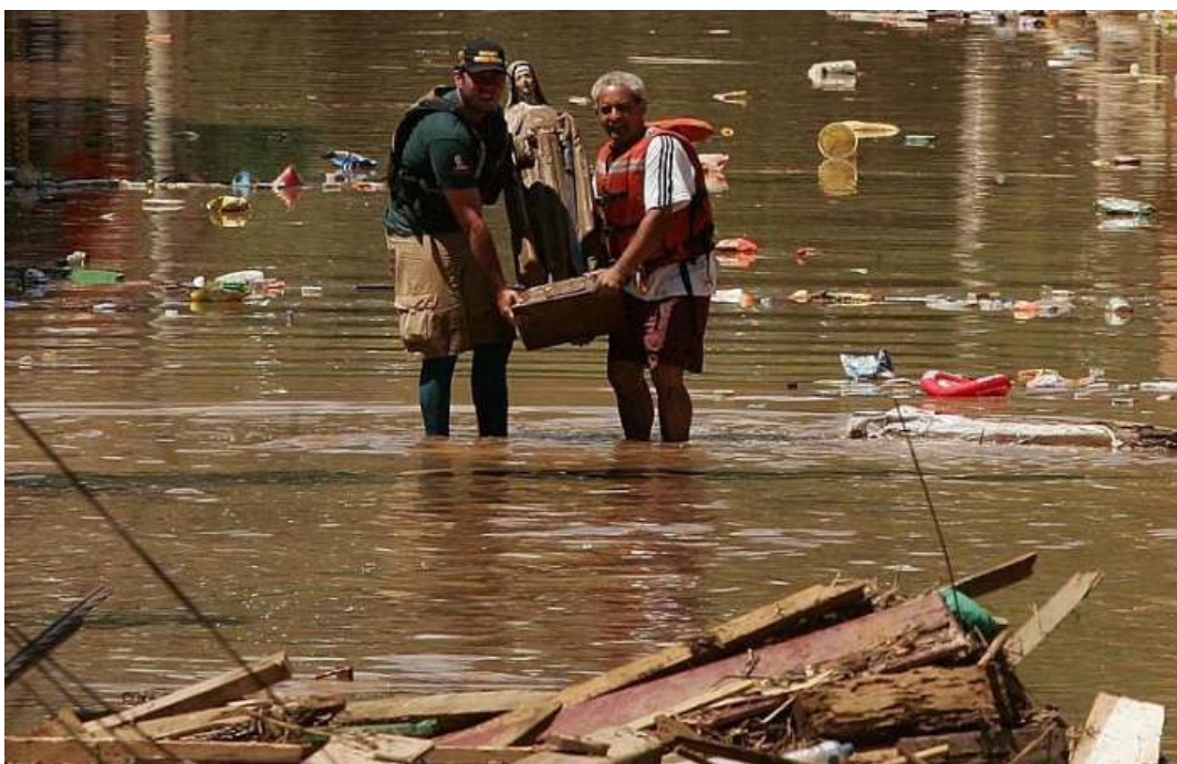
FIGURA 7 – POPULAÇÃO SALVANDO AS IMAGENS SACRAS DOS ESCOMBROS DA IGREJA MATRIZ DE SÃO LUIZ DE TOLOSA, EM 2010