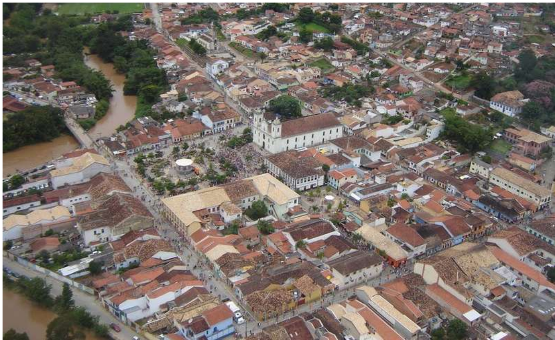
FIGURA 2 – IMAGEM ÁREA DO CENTRO HISTÓRICO DE SÃO LUIZ DO PARAITINGA, EM 2009.