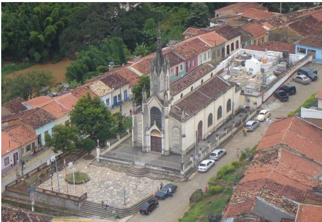
FIGURA 3 – IGREJA DO ROSÁRIO DOS HOMENS PRETOS E A RUA DO CARVALHO, EM 2009.