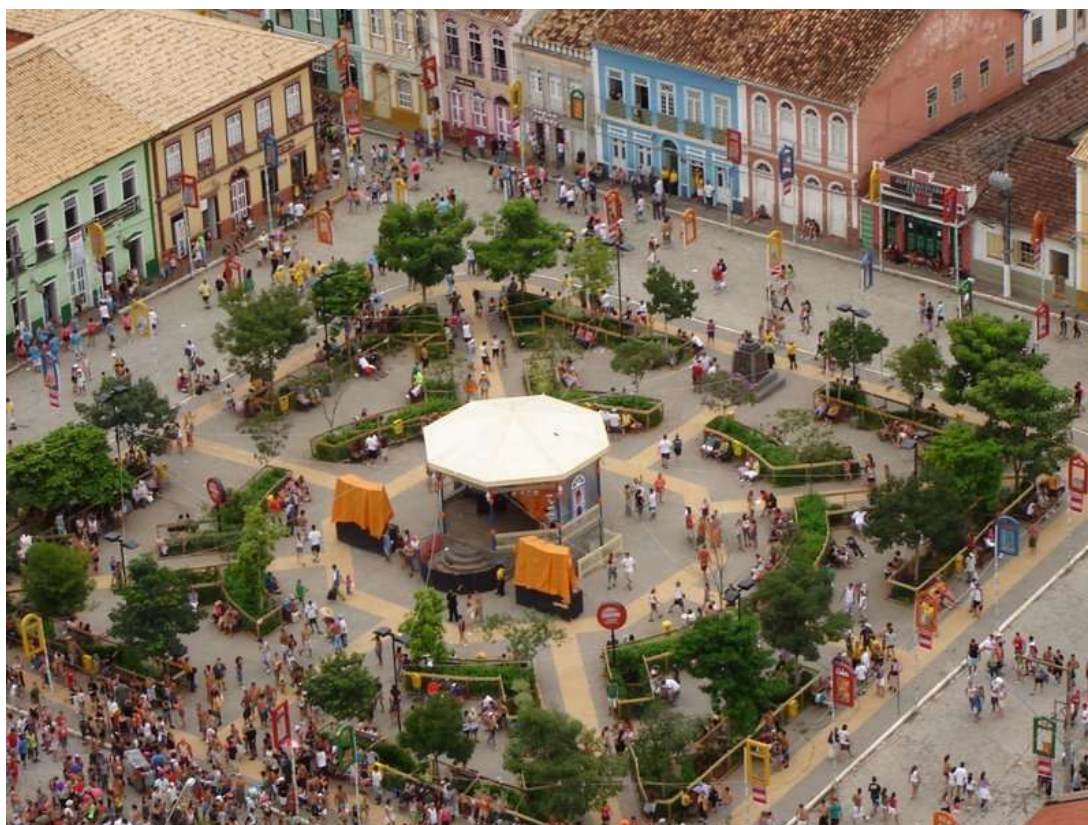
FIGURA 4 – PRAÇA DR. OSWALDO CRUZ, EM 2009

Mesmo com o intuito de privar essa população mais pobre de residir na área mais valorizada da cidade (a praça), não foi possível privá-la de vivenciar esse espaço, devido às dimensões desse núcleo urbano. Sendo assim, a Praça da Matriz, desde a época de sua fundação, até os dias de hoje, se constitui com um espaço da vida por excelência.