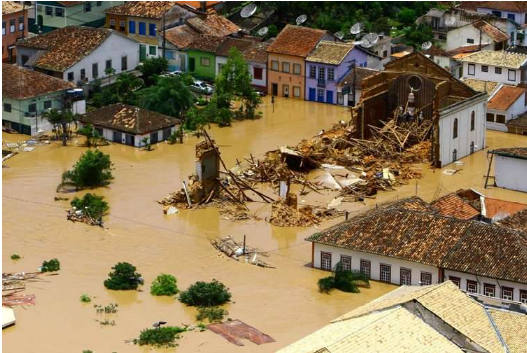
FIGURA 6 – DESABAMENTO DA IGREJA MATRIZ DE SÃO LUIZ DE TOLOSA, EM 2010