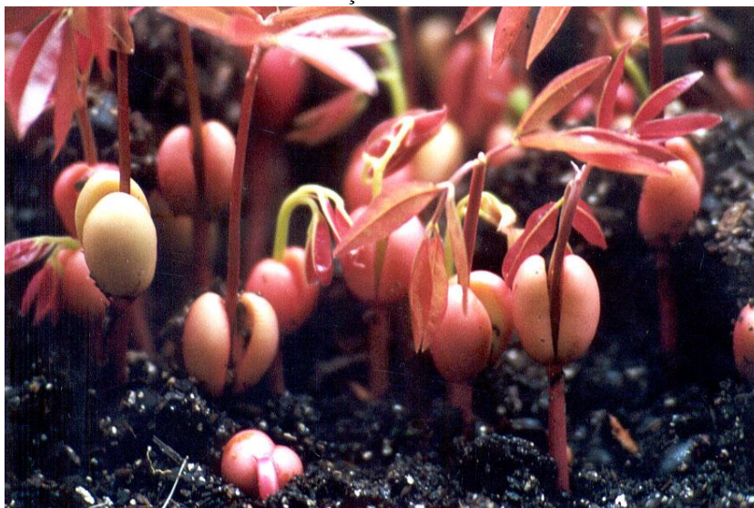
FIGURA 05 – GERMINAÇÃO DA SEMENTE DA COPAÍBA

No período noturno, as copaíbas são ponto de encontro de diversos mamíferos, como os macacos mono-carvoeiros ( Cebus apella nigrinus ), observados por Beritti (2000) no Parque Nacional de Iguazu, na Argentina, e que utilizam sua copa como ponto de descanso noturno, como pequenos roedores que apreciam os frutos e são atraídos pelo cheiro de 14 cumarina presente nas sementes maduras e, por último, os indígenas, no norte do país, que apreciam a carne destes pequenos roedores e utilizam as copaíbas como local de espera de caça.