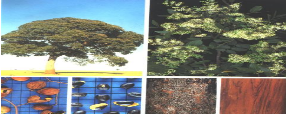
FIGURA 04 – A COPAÍBA

toco), a galha-do-campo ( Cyanocorax cristatellus ) e o sabiá, que engolem o 13 arilo e regorgitam a semente (CARVALHO, 1984).