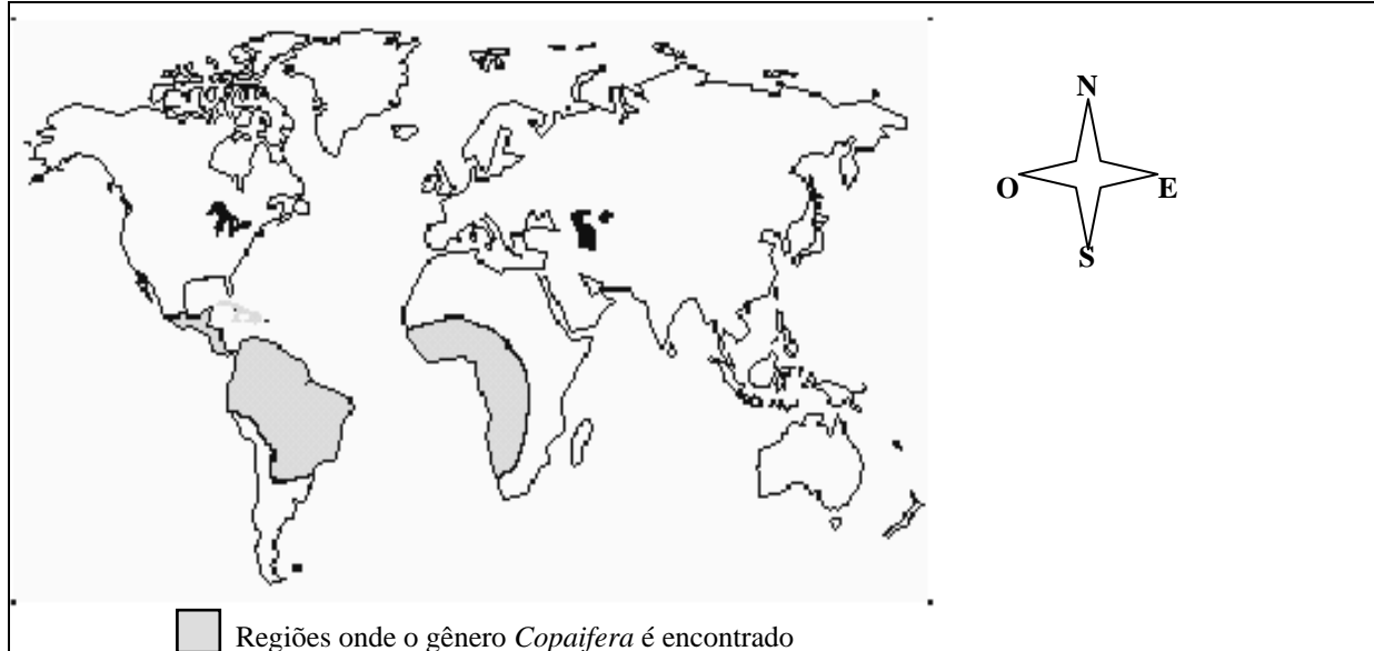
MAPA 01 - ÁREAS DE OCORRÊNCIAS DO GÊNERO COPAÍFERA