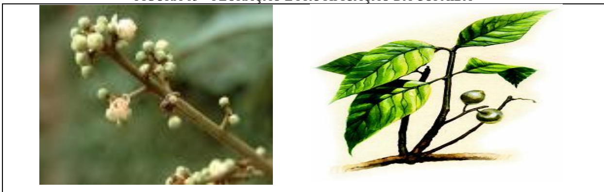
FIGURA 03 – FLORAÇÃO E FRUTIFICAÇÃO DA COPAÍBA

A casca é fissurada, caule tipo tronco e possui coloração escura, medindo de 0,4 a 4 metros de diâmetro. Sua identificação botânica é realizada, na maioria das vezes, segundo características das flores, como: pêlos nas sépalas, comprimento dos anteros e a condição glabrosa ou não do pistilo, (DWYER, 1951). As características dos frutos são igualmente importantes, mas estes são dificilmente encontrados em coleções botânicas.