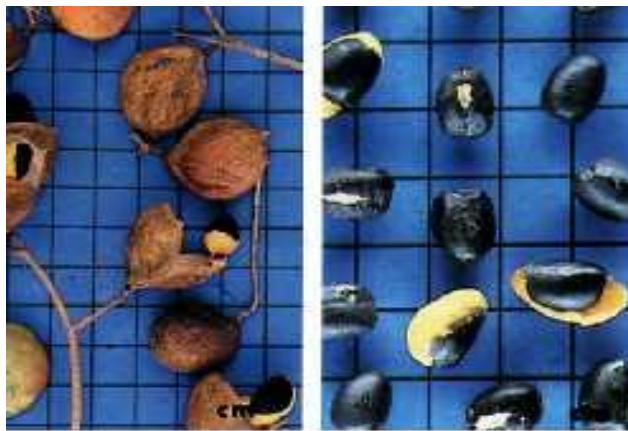
FIGURA 02 - O FRUTO E A SEMENTE DA COPAÍBA

Nas regiões onde ocorre acentuado período seco é rara ou ocasional e cresce em temperaturas ideais de 17° a 28° C de crescimento lento, alcançam de 25 a 40 metros de altura, podendo viver até 400 anos. Tem casca castanha – escura, rugosa e aromática. Apresenta 2 folhas alternas e 3 pecioladas simples e compostas, 4 paripenadas, tendo na base do 3 pecíolo pequenas 5 estípulas, 6 folíolos com 3 a 4 pares opostos, 7 coriáceos e lisos com 8 peninérvias e alternas. As folhas são cheias de glândulas contendo óleo resinoso. As folhas quando recém brotadas mostram tonalidades avermelhadas revestindo toda a copa.