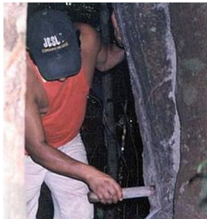
FIGURA 06 – EXTRAÇÃO DO ÓLEO DA COPAÍBA

A comunicação oral é o principal modo pelo qual o conhecimento é perpetuado. Isto acontece normalmente em sociedades rurais ou indígenas, nas quais o aprendizado é feito pela socialização no interior do próprio grupo doméstico e de parentesco. Uma das origens do sistema brasileiro de plantas medicinais deriva das características peculiares da flora da região Amazônica associada à absorção de conhecimentos indígenas e 15 quilombolas pelo caboclo. Ele também decorre do isolamento cultural da Amazônia, que levou ao uso de ervas específicas da região uma linguagem própria. É o caso da planta como Copaíba.