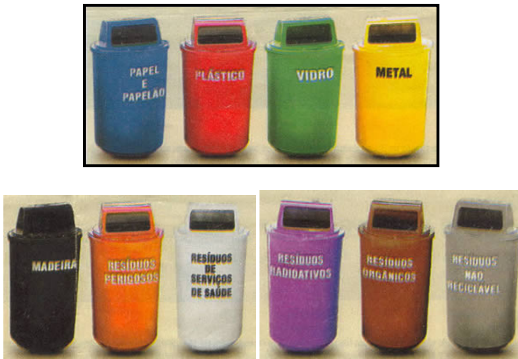
FIGURA 02 –TAMBORES UTILIZADOS NA COLETA SELETIVA DO LIXO

tipos de resíduos, como pode ser observado (figura 05), estes são colocados em locais públicos e de fácil acesso.