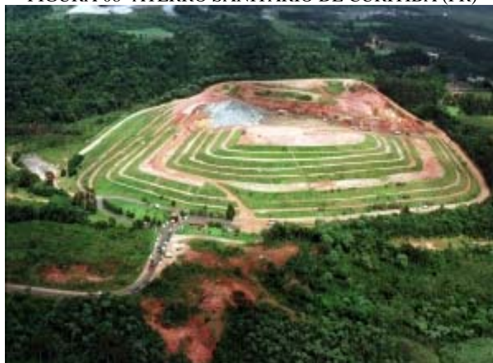
FIGURA 08- ATERRO SANITÁRIO DE CURITIBA (PR)