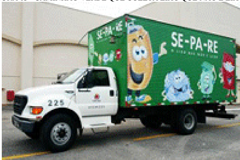
FIGURA 03 - CAMINHÃO VERDE QUE COLETA LIXO QUE NÃO É LIXO