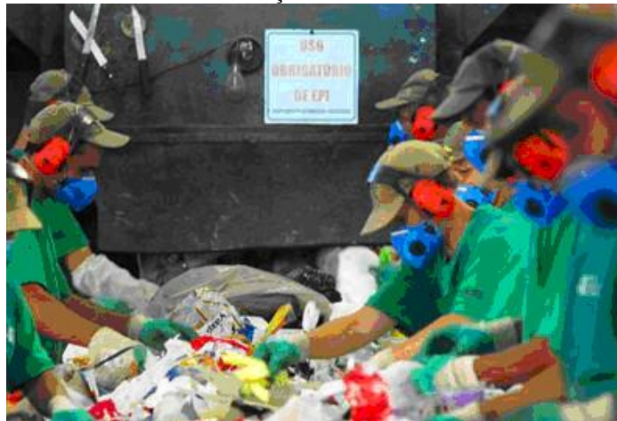
FIGURA 06: USINA DE VALORIZAÇÃO DE REJEITOS DE CAMPO MAGRO-PR