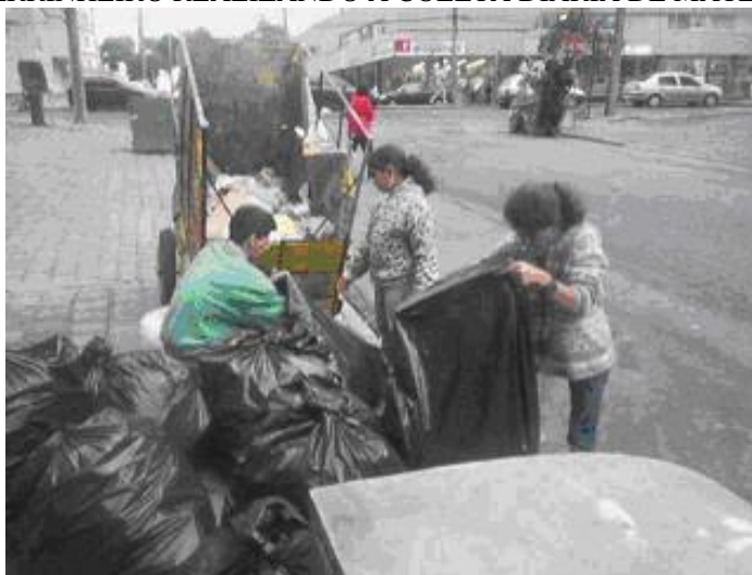
FIGURA 05 CARRINHEIRO REALIZANDO A COLETA DIÁRIA DE MATERIAL RECICLADO