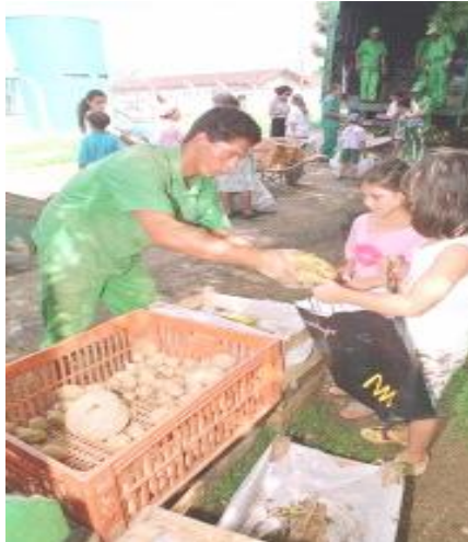
FIGURA 07-POSTO DE TROCA DE MATERIAIS RECICLADOS POR ALIMENTOS