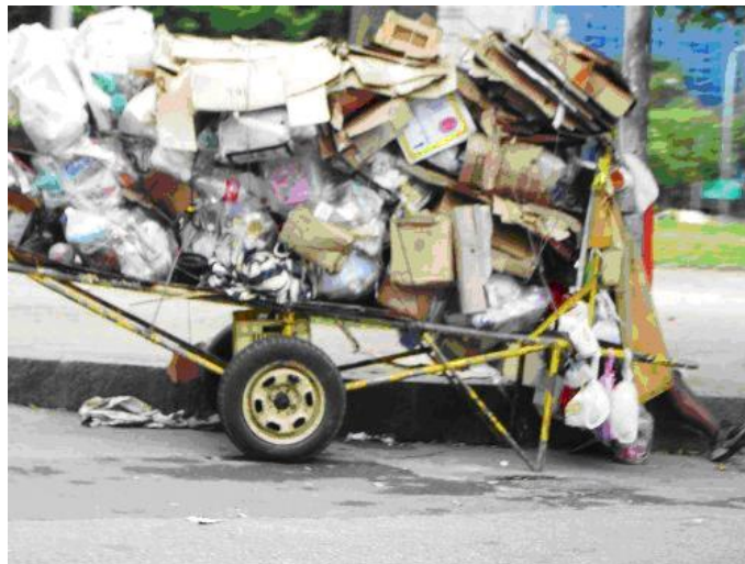
FIGURA 04 - CARRINHEIRO REALIZANDO A COLETA DIÁRIA DE MATERIAL RECICLADO: