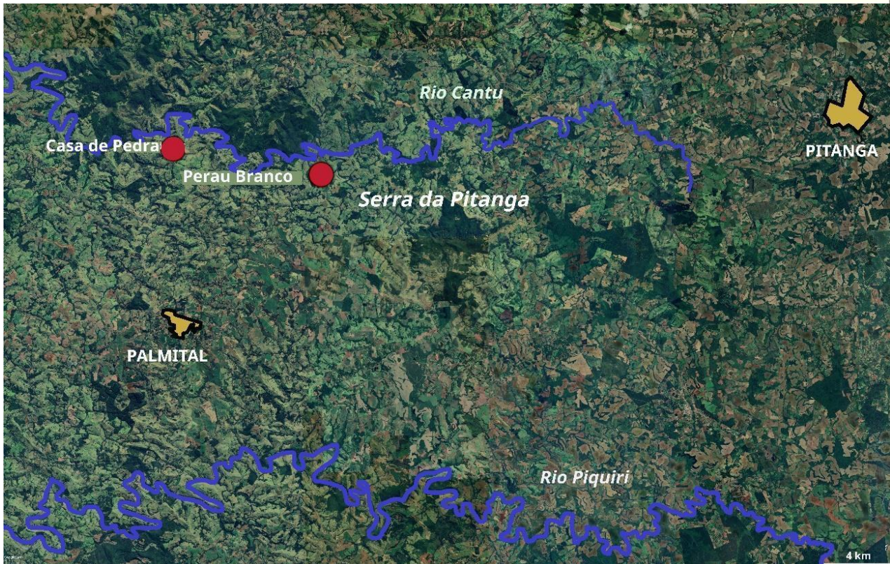
Figura 2 – Localização da Casa das Pedras, Perau Branco (coordenadas fornecidas por Waichel et al. (2013)). Imagem extraída do software Google Earth® em 28 junho de 2024.

Cavernas em rochas basálticas são pouco comuns na natureza. A primeira evidência de ocupação humana de tubos vulcânicos foi descrita, recentemente, por Stewart et al. (2024) na Península Arábica. Trata-se da caverna Umm Jirsan, no norte da Arábia Saudita, usada ao longo de mais de 7000 mil anos, entre o Neolítico e a Idade do Bronze, como abrigo por pastores nômades que percorriam uma rota que interconectava oásis. É possível que cavernas da Serra da Pitanga tenham sido usadas com o mesmo propósito, ou seja, como abrigos temporários, pois a serra margeia o Caminho Peabiru em um trecho onde a trilha pré-colonial possuía várias ramificações segundo o traçado proposto por Reinhard Maac (2017) com base no itinerário percorrido pelo soldado Ulrich Schimidel no século XVI (Chmyz & Sauer 1971).