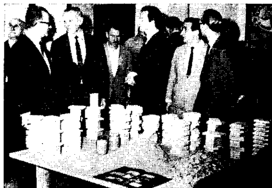
Flagrante da visita do Prefeito de Curitiba, Eng o Omar Sabbag, por ocasião da abertura da IV PRODEMA

A solenidade de abertura deu-se às 9:00 horas da manhã do dia 14 de junho, presentes altas autoridades, quando o presidente da comissão organizadora ressaltou a importância da Mostra como fator educativo, afirmando que é necessário que haja a Educação Florestal do povo para que se afirme uma Política Florestal e desta resulte uma eficiente Legislação .