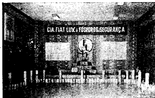
"Stand" da Cia. Fiat Lux de Fósforos de Segurança, que obteve o primeiro lugar

O resultado final apresentou a vitória da Companhia Fiat Lux de Fósforos de Segurança (média 8.55), cabendo o se-