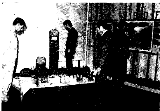
"Stand" do Instituto Brasileiro de Desenvolvimento Florestal-IBDEF

Nos nove dias em que esteve aberta a Exposição, registrou-se a presença de aproximadamente 7.000 pessoas, apesar do tempo chuvoso que perdurou durante a semana.