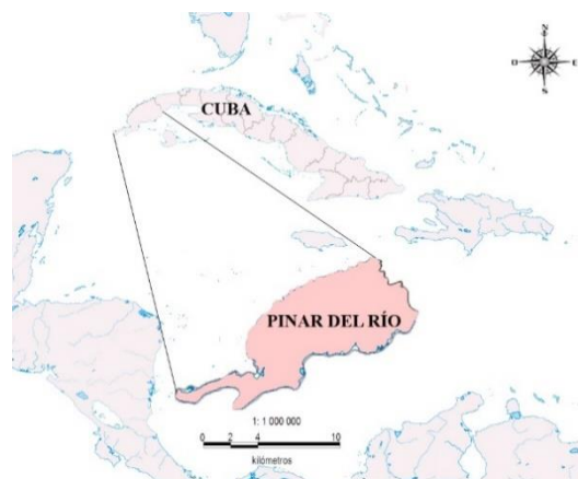
Figura 1. Ubicación de la provincia Pinar del Río. Figure 1. Location of the Pinar del Río province.