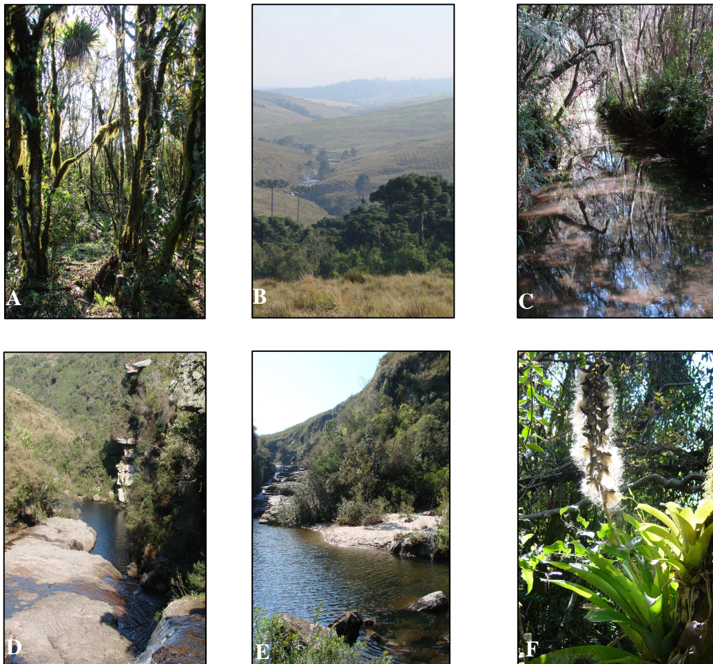
Figura 1. Áreas de estudo. A: cabeceira; B: em primeiro plano, floresta da foz do rio Bugio; C: foz do rio Bugio; D: vista geral do cânion; E: área de estudo no cânion; F: Vriesea platynema com sementes.

A segunda área localiza-se na foz do primeiro grande afluente do rio Tibagi, rio Bugio, em 900 m de altitude, onde a floresta se desenvolve em encosta, com declividades da rampa entre 8 e 20% (ondulado) (Figuras 1B e 1C). As declividades longitudinais do rio são superiores às anteriores, conferindo um ambiente de maior energia. As margens fluviais são constituídas por Neossolos Flúvicos, gradando rapidamente para Cambissolos Háplicos e Neossolos Litólicos. Os indivíduos arbóreos da floresta dessa área apresentam o maior porte dentre as áreas estudadas, com um indivíduo de Araucaria angustifolia que alcançou 17 m de altura e 88 cm de diâmetro. As espécies mais comuns pertencem à Myrtaceae, Euphorbiaceae, Rubiaceae e Lauraceae, representadas especialmente por Myrcia pulchra Kiaersk., Sebastiania commersoniana (Baill.) L. B. Sm. & Downs, Coussarea contracta (Walp.) Müll. Arg. e Nectandra grandiflora Ness & C. Mart. ex Ness.