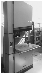
Serra de fita