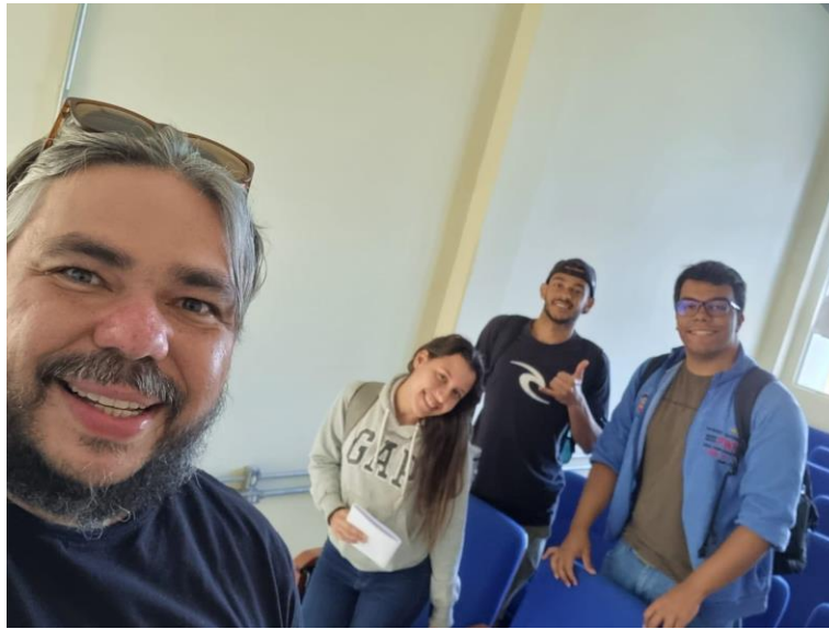
Figura 3 - Projeto “Páginas ao meio-dia”, terceiro encontro.