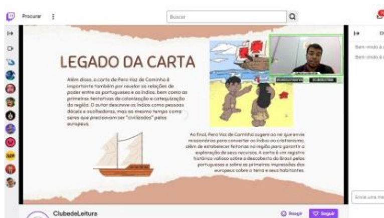
Figura 4 - Projeto “Cultura Interligada”, primeira transmissão.