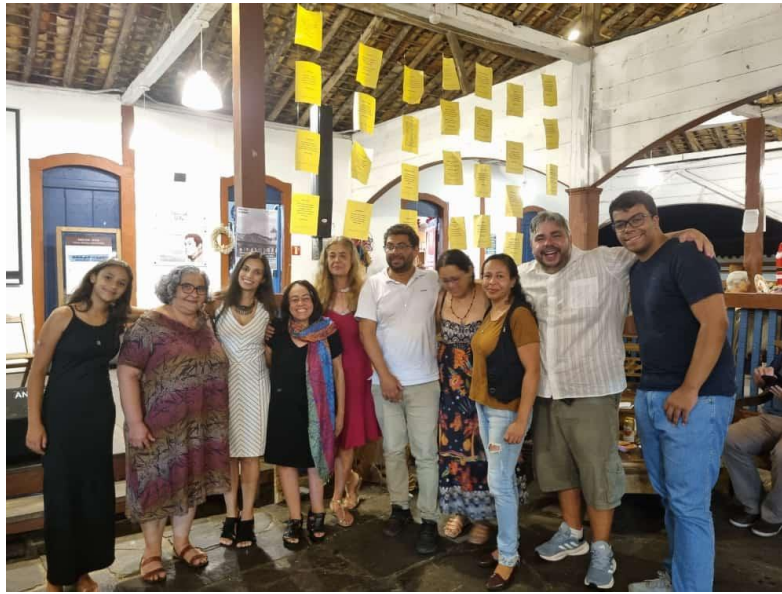
Figura 5 - Projeto “Mosaico Literário”, Terceiro encontro.